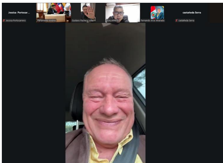
Imagen: Sesiones internas de la representación nacional del Parlamento Andino (17.11.2025)

No habiéndose presentado pedidos adicionales, el vicepresidente de la Representación Nacional dio por concluida la sesión.