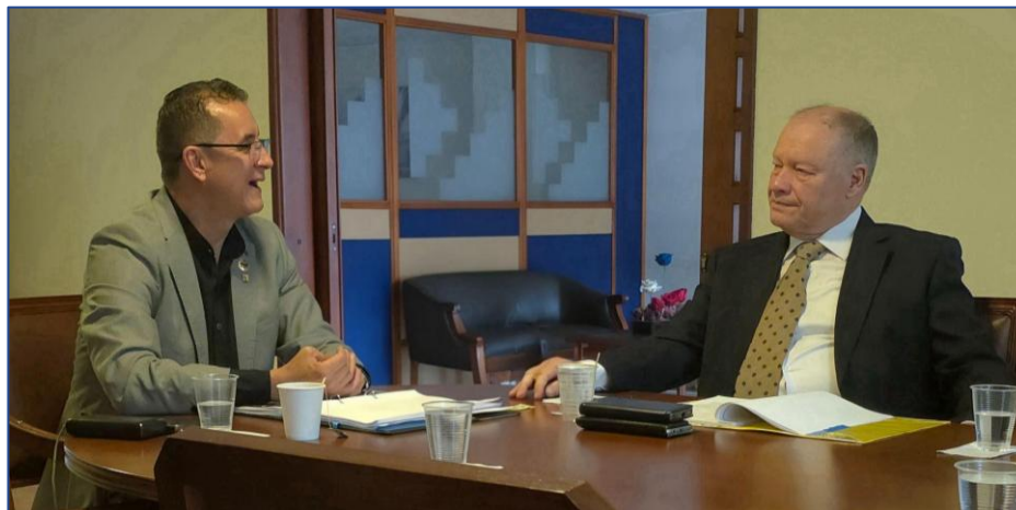
Imagen: Sesión de la Comisión Quinta del Parlamento Andino (20.11.2025)