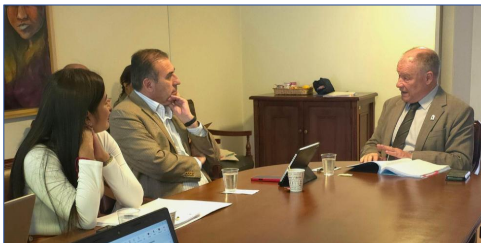
Imagen: Sesión de la Comisión Especial de Futuro del Parlamento Andino (19.11.2025)