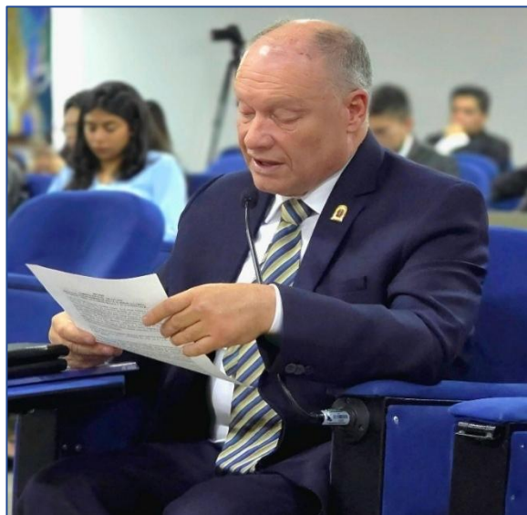
Imagen: Lectura y aprobación del informe de la Comisión Especial de Futuro del Parlamento Andino (21.11.2025)