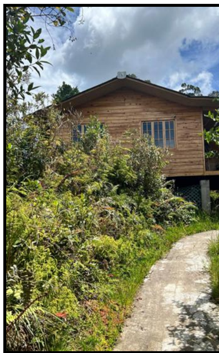
Imagen: Instalaciones del Ulcumano Ecolodge

El análisis busca aportar insumos técnicos y prácticos para fortalecer las políticas andinas y nacionales de conservación, con énfasis en la sostenibilidad de las áreas bajo conservación y la articulación entre el Estado, el sector privado y la sociedad civil.