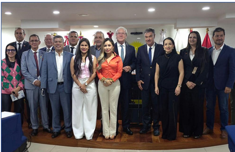
Imagen: Fotografía institucional tras presentación del titular de la Secretaría General de la CAN en la sesión Plenaria del Parlamento Andino (21.11.2025)