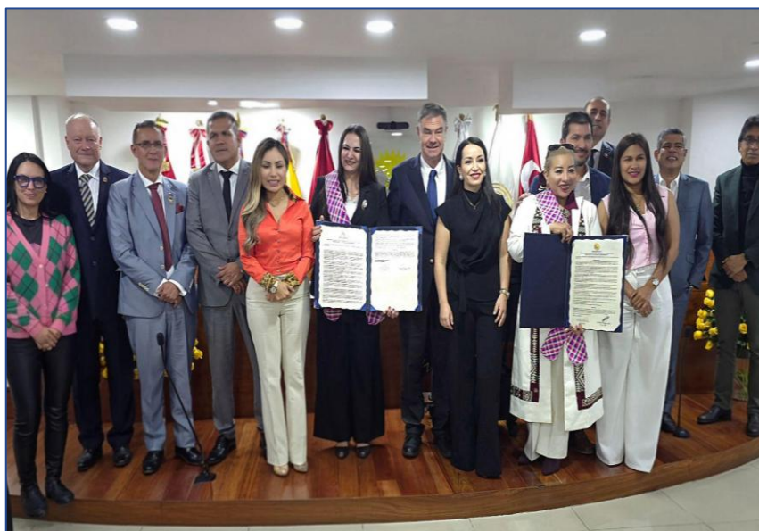
Imagen: Entrega de las condecoraciones Manuela Sáenz a la Integración Latinoamericana (21.11.2025)