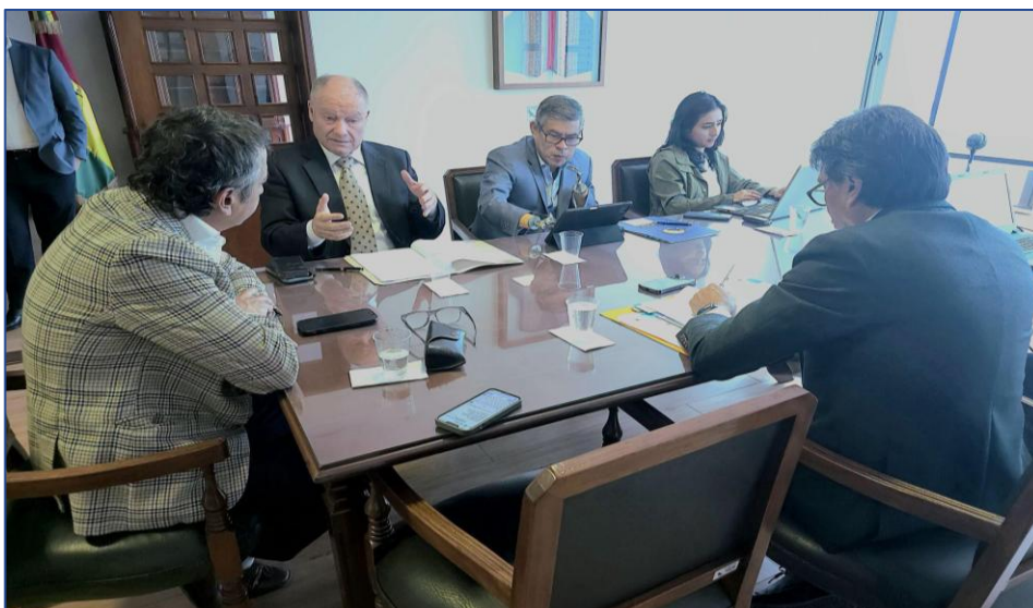
Imagen: Sesión de la Comisión Cuarta del Parlamento Andino (20.11.2025)