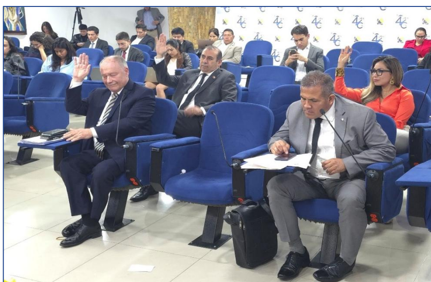
Imagen: Votación de los informes de las comisiones durante la Plenaria del Parlamento Andino (21.11.2025)