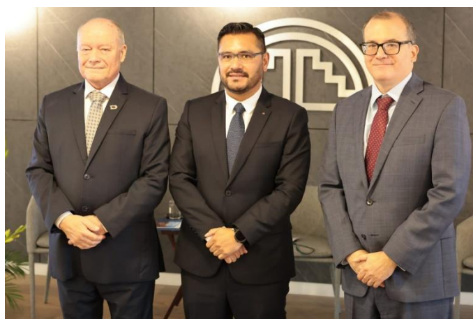
Imagen: Sesión inaugural del Segundo Taller Regional de Difusión sobre Marcos Normativos en Materia Ambiental (18.03.2026)