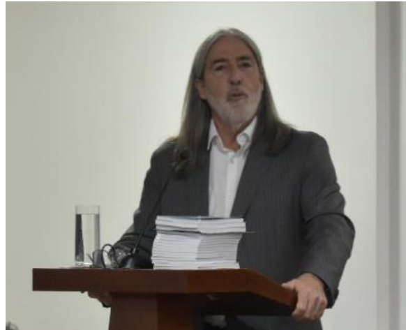
Imagen: intervención del Dr. Juan Pablo Letelier, director del Instituto de Gobernanza, Liderazgo Democrático y Estudio del Derecho Parlamentario (27.03.2026)

Durante su intervención, el doctor Letelier destacó que el metano es uno de los gases de efecto invernadero con mayor capacidad de calentamiento en el corto plazo, por lo que su reducción constituye una medida estratégica para mitigar el cambio climático de manera inmediata. En ese sentido, subrayó la urgencia de que los países de la región cuenten con marcos normativos sólidos y técnicamente sustentados que permitan regular y reducir estas emisiones.