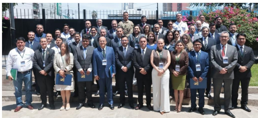
Imagen: Foto protocolar del Segundo Taller Regional de Difusión sobre Marcos Normativos en Materia Ambiental (18.03.2026)

Entre los principales resultados del taller, destaca la propuesta de creación de un Comité Andino de Autoridades Forestales , concebido como un mecanismo permanente de coordinación técnica entre los países de la Comunidad Andina. Este comité permitirá establecer estándares comunes en trazabilidad, fortalecer el control forestal, armonizar marcos normativos y promover la construcción de Decisiones Andinas en la materia. Asimismo, contribuirá a mejorar la articulación frente a dinámicas transfronterizas de ilegalidad y a consolidar una gobernanza forestal regional más eficiente.