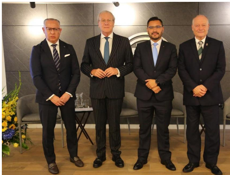
Imagen: Sesión inaugural del Segundo Taller Regional de Difusión sobre Marcos Normativos en Materia Ambiental (19.03.2026)

Cabe precisar que el informe detallado será presentado en el siguiente informe mensual del despacho.