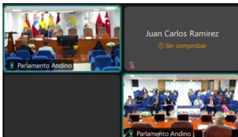
Imagen: Sesión Plenaria del 26 de marzo