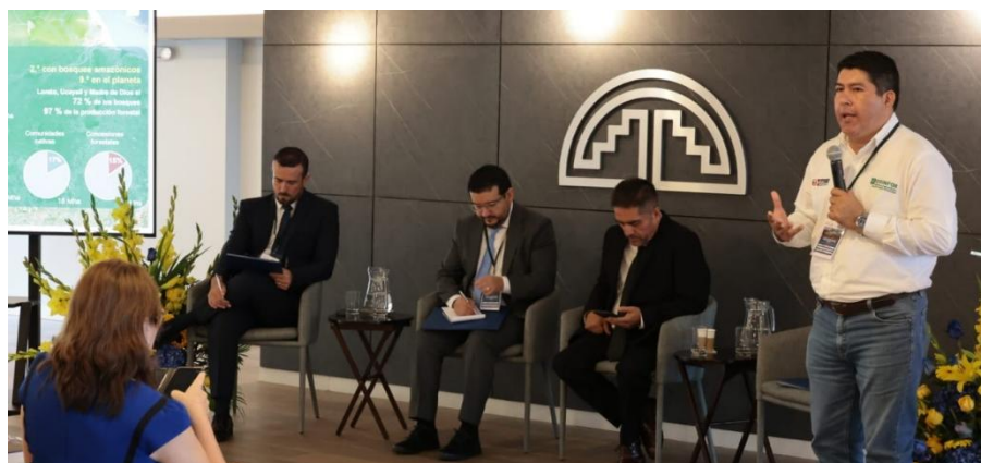
Imagen: Bloque de intervenciones sobre los avances en materia de lucha contra la tala ilegal en la región andina (18.03.2026)