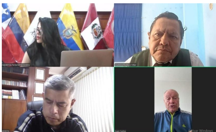
Imagen: sesión ordinaria de la Representación Parlamentaria Nacional del Perú ante el Parlamento Andino. (23.03.2026)

Tras la verificación del quórum reglamentario, el vicepresidente dio inicio a la sesión. Como primer punto del orden del día, se procedió a la revisión del acta correspondiente a la sesión anterior; al no haberse presentado observaciones por parte de los parlamentarios, esta fue aprobada por unanimidad.