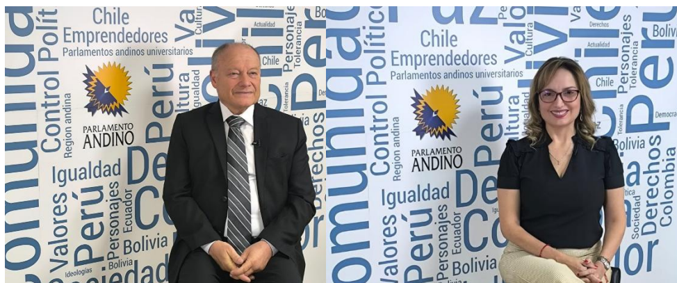
Imagen: Entrevista para el programa Voces Andinas del canal institucional del Parlamento Andino TV (26.02.2026)

Finalmente, señalé que la protección de los bosques es una prioridad estratégica, dado que estos son fundamentales para el equilibrio climático, la conservación de la biodiversidad y la propia supervivencia humana. En ese sentido, los marcos normativos contribuyen a cumplir los compromisos internacionales asumidos por nuestros países y a promover acciones concretas de conservación que armonicen el desarrollo económico con la sostenibilidad ambiental.