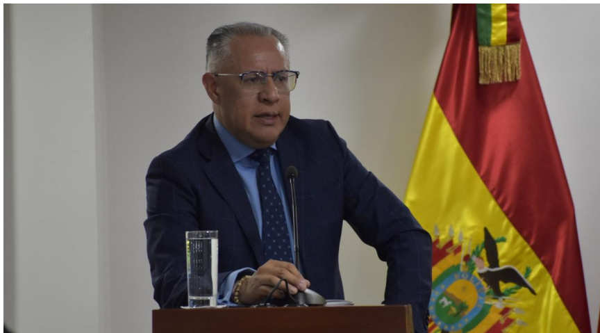
Imagen: Plan de Gestión Institucional del Parlamento Andino para el año 2026 (26.02.2026)

directrices y compromisos internacionales del Parlamento Andino, entre ellos los asumidos en la Asamblea Parlamentaria Euro-Latinoamericana (EuroLat) así como las orientaciones del Consejo Presidencial Andino, las reuniones del Sistema Andino de Integración y los encargos formulados por las presidencias pro tempore de la Comunidad Andina.