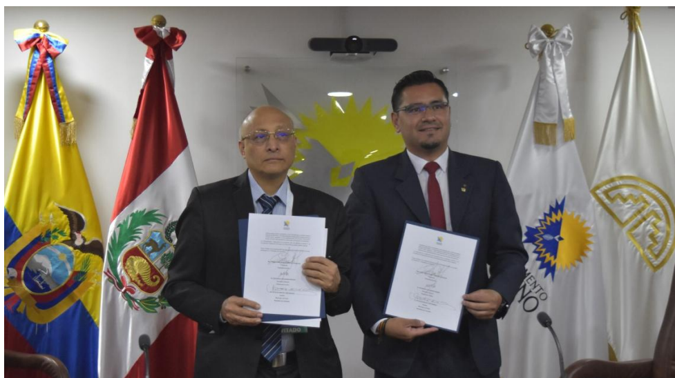
Imagen: Suscripción de la Carta de Adhesión del municipio de San Juan de Pasto (Colombia) a la Red Andina de Autoridades Territoriales (26.02.2026)