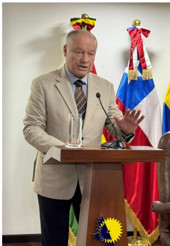
Imagen: Presentación y debate de la propuesta de Norma Comunitaria sobre Salud Mental (27.02.2026)

En ese sentido, precisé que la propuesta de norma comunitaria presentada plantea, entre otros aspectos: