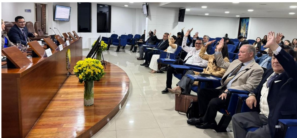
Imagen: Votación del proyecto de pronunciamiento para declarar al Ramal Ferroviario Talca–Constitución como patrimonio cultural de la región andina.