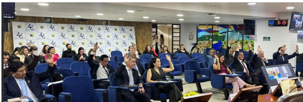
Imagen: Votación del Proyecto de Presupuesto Anual Institucional para la vigencia 2026