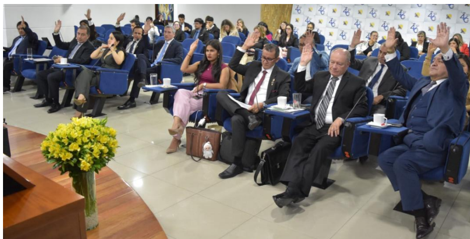
Imagen: Votación de los informes de comisiones permanentes (26.02.2026)

la articulación de sistemas sanitarios; además de buscar que las propuestas estén alineadas con los lineamientos de la OMS y la OPS.