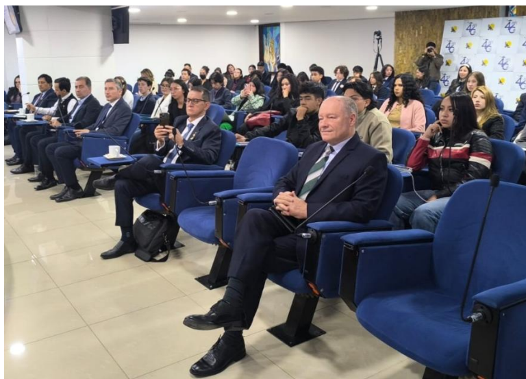
Imagen: Lanzamiento Escuela Andina de Debate (25.02.2023)

andinos, con una red de aproximadamente 3.800 jóvenes, cuyas propuestas han sido incorporadas en el plan de gestión institucional e incluso han motivado procesos de armonización legislativa. En ese marco, explicó que la Escuela Andina de Debate, promueve la participación de académicos y referentes que acompañen a los jóvenes en el desarrollo de habilidades de reflexión, debate y liderazgo.