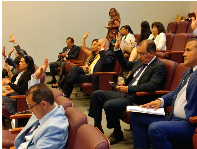
Imagen: Votación Informe Comisión Quinta (30.01.2026)