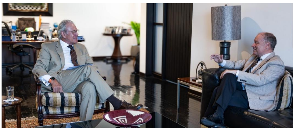
Imagen: Reunión con el secretario general de la Comunidad Andina (20.01.2026)