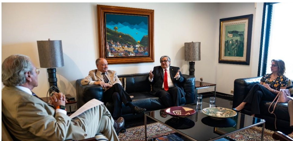
Imagen: Reunión con el secretario general de la Comunidad Andina (20.01.2026)

reuniones técnicas entre el equipo de la CAN y el de mi despacho para trabajar en pro de lograr este objetivo.