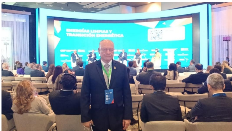
Imagen: Energías Limpias y Transición Energética- Foro Económico CAF 2026 (28.01.2026)

Finalmente, en la sesión “La Voz del Sector Privado: La Ruta de la Expansión Regional” , líderes empresariales reflexionaron sobre los desafíos de crecer en América Latina en contextos regulatorios y culturales diversos. Se destacó que la expansión regional requiere no solo presencia en nuevos mercados, sino excelencia operativa, alianzas estratégicas y gestión adecuada de riesgos. A partir de experiencias concretas, se identificaron factores clave para transformar la ambición empresarial en crecimiento sostenible y en mayor integración económica regional.