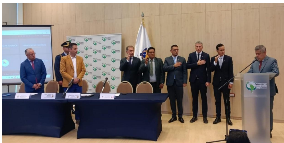
Imagen: Sesión Solemne de Juramentación: Delegación de la República Multicultural de Bolivia (30.01.2026)