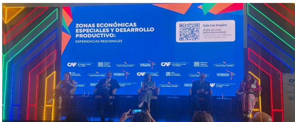
Imagen: “Zonas Económicas Especiales y desarrollo productivo: experiencias regionales”- Foro Económico CAF 2026 (28.01.2026)

Finalmente, en la sesión “Zonas Económicas Especiales y desarrollo productivo: experiencias regionales” , se evaluó el desempeño de las ZEE como instrumentos de política industrial. Si bien en Asia han mostrado resultados exitosos, en América Latina su impacto ha sido heterogéneo. Los panelistas coincidieron en que su efectividad depende de marcos regulatorios claros, incentivos adecuados, infraestructura competitiva y articulación con las economías locales, destacando su potencial para impulsar la diversificación productiva y el empleo de calidad.