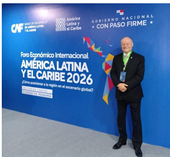
Imagen: Foro económico Internacional “¿Cómo posicionar a la región en el escenario global?” (28.01.2026)

El día 28 de enero, asistí al Foro Económico Internacional América Latina y El Caribe 2026 – CAF : “¿Cómo posicionar a la región en el escenario global?”, donde se dieron cita líderes regionales y globales, expertos y empresarios para debatir los desafíos económicos, tecnológicos y ambientales de la región ante un entorno global cambiante, con énfasis en innovación, estabilidad y acción climática. Este evento organizado por CAF, Banco de Desarrollo de América Latina y el Caribe, tuvo el propósito de ser el principal punto de reunión política y económica para analizar el posicionamiento de la región en un contexto global cambiante.