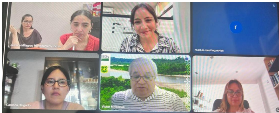
Imagen: Reunión con el equipo de ILAT (19.01.2026)

Entre otros temas, se determinaron las fechas límite para compra de pasajes, la elección de hoteles y la lista de participantes.