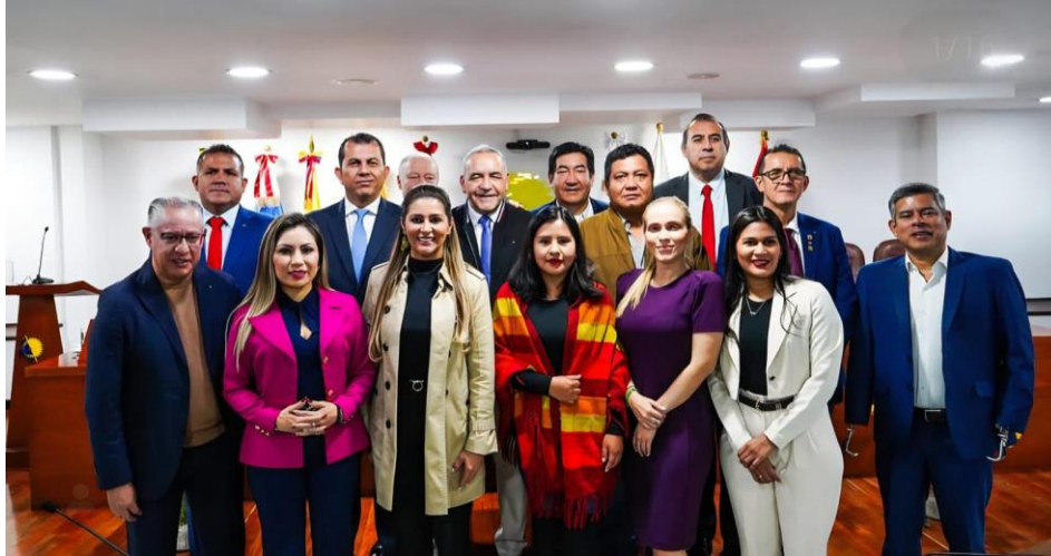
Presentación del Encuentro Suramericano en Defensa de la Cordillera de los Andes a cargo de la gobernadora de Tolima, Colombia (29.08.2025)

Finalmente, se firmó la adhesión de la Gobernación de Tolima a la Red Andina de Autoridades Territoriales del Parlamento Andino.