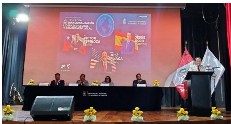
Imagen: Mesa de Honor de la I Conferencia Internacional “UNTELS GLOBAL: Internacionalización, liderazgo global y compromiso local” (28.08.2025)

Además, resaltó la fundación de 25 universidades en América (influencia española) versus cero universidades en Brasil (influencia portuguesa), e indicó que las primeras gramáticas posteriores al español no fueron el inglés o francés, sino las lenguas indígenas codificadas por religiosos españoles. Finalmente, destacó la importancia de la comunicación y la construcción de narrativas históricas para el desarrollo de identidad y proyección futura.