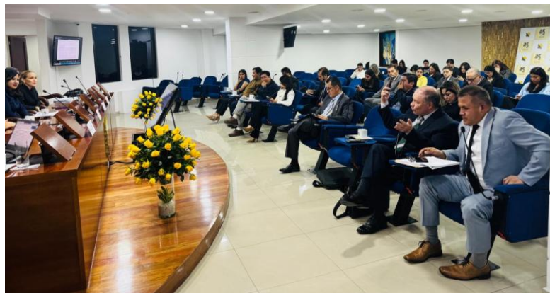
Imagen: Aprobación de la Recomendación sobre la Ciberdelincuencia (28.08.2025)