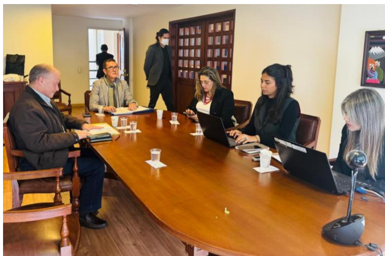
Imagen: Sesión de la Comisión Quinta (27.08.2025)

Se instaló la sesión Plenaria de esta fecha, contando entre los puntos de orden del día con los debates de los informes de la sesión de Mesa Directiva y las Comisiones, así como el debate y votación de proyectos de instrumentos de pronunciamiento.