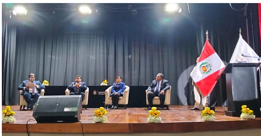
Imagen: Mesa de panelistas de la I Conferencia Internacional "UNTELS GLOBAL: Internacionalización, liderazgo global y compromiso local" (28.08.2025)

En la conferencia se evidenció que el Perú cuenta con antecedentes históricos de innovación temprana y capacidad de desarrollo de infraestructura. Sin embargo, la falta de implementación de políticas de largo plazo y la ausencia de ecosistemas de desarrollo de tecnología han limitado el aprovechamiento de este potencial. Además, se subrayó la importancia de determinar si el Perú aspira a posiciones de liderazgo global o se conforma con roles regionales intermedios. Finalmente, se aportaron perspectivas históricas, marcos teóricos actuales y experiencias prácticas que concluyeron en la necesidad de implementar soluciones tales como: infraestructura, como factor determinante del desarrollo, ecosistemas de innovación para desarrollar el talento inventivo, marco de evaluación de políticas públicas para obtener el impacto deseado; además, reorientar la educación superior hacia el emprendimiento y la creación de valor.