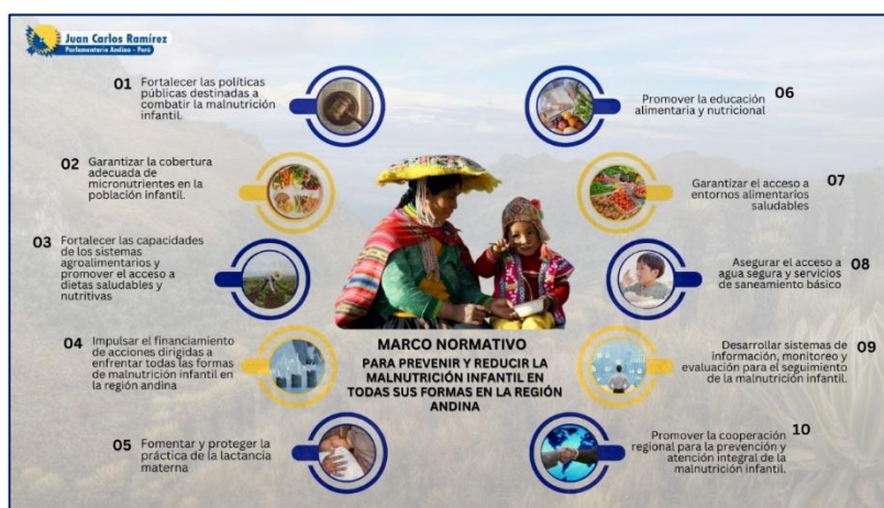
Imagen: Principales lineamientos del Marco Normativo para Prevenir y Reducir la Malnutrición Infantil en la región Andina (29.08.2025)

Al final del debate, se procedió a la votación y el proyecto fue aprobado por unanimidad.