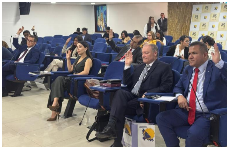
Imagen: Segunda sesión Plenaria de setiembre (29.08.2025)