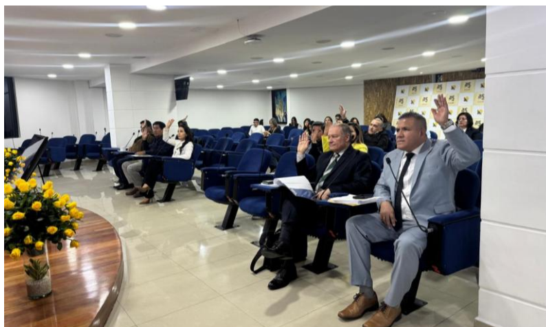
Imagen: votación de los informes de Comisiones Permanentes y Especiales (28.08.2025)

A continuación, se procedió al debate y votación de los proyectos de pronunciamiento, entre los cuales se aprobaron: