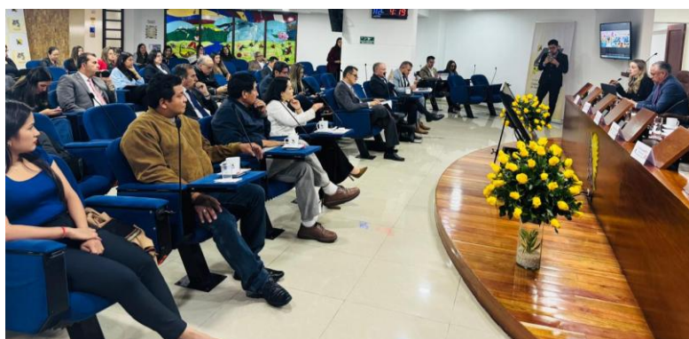
Imagen: Primera sesión plenaria de agosto (28.08.2025)