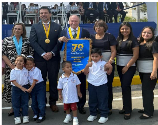
Imagen: Participación en el Aniversario del distrito de San Bartolo (05.05.2025)

En mi participación resalté el carácter emprendedor del distrito, así como sus atractivos turísticos y comerciales, pues San Bartolo ha sido testigo de innumerables transformaciones, desde sus inicios como una pequeña zona veraniega hasta convertirse en un importante destino de recreación, deporte y cultura.