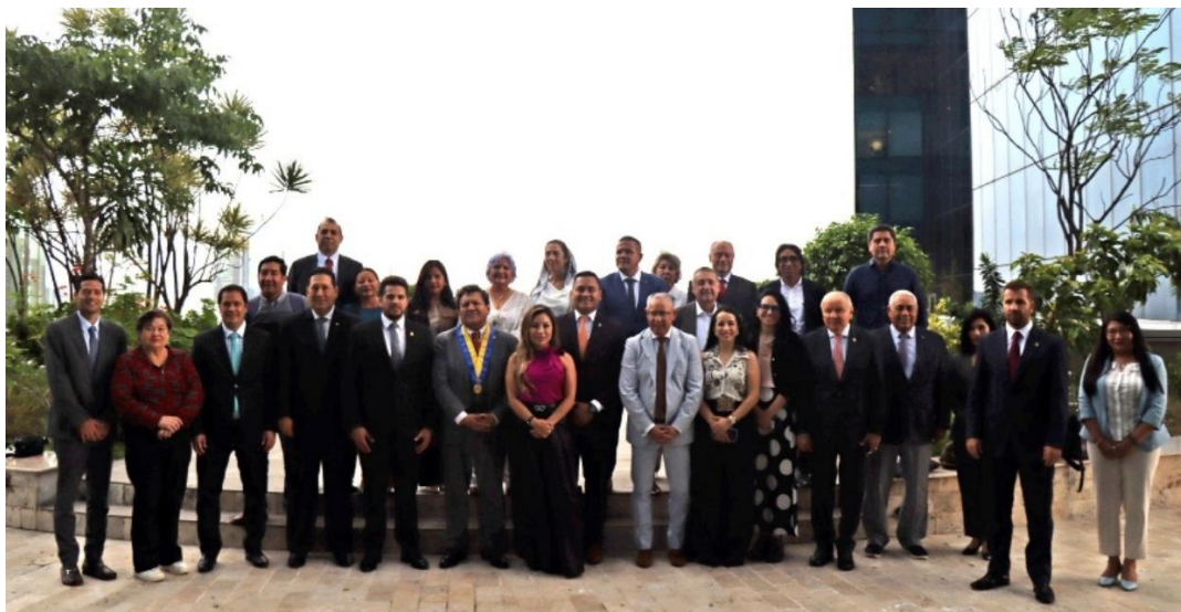
Imagen: Sección conjunta entre el Parlamento Andino y UPLAC (16.05.2025).