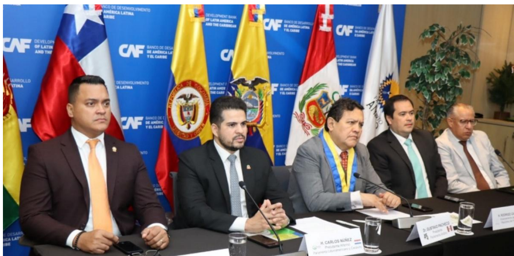
Imagen: Sesión conjunta entre el Parlamento Andino y UPLAC (16.05.2025).