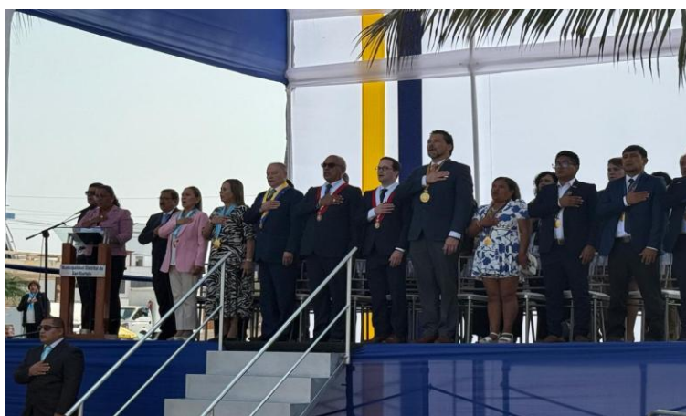
Imagen: Participación en la Mesa de Honor, Aniversario 79° del distrito de San Bartolo (05.05.2025)