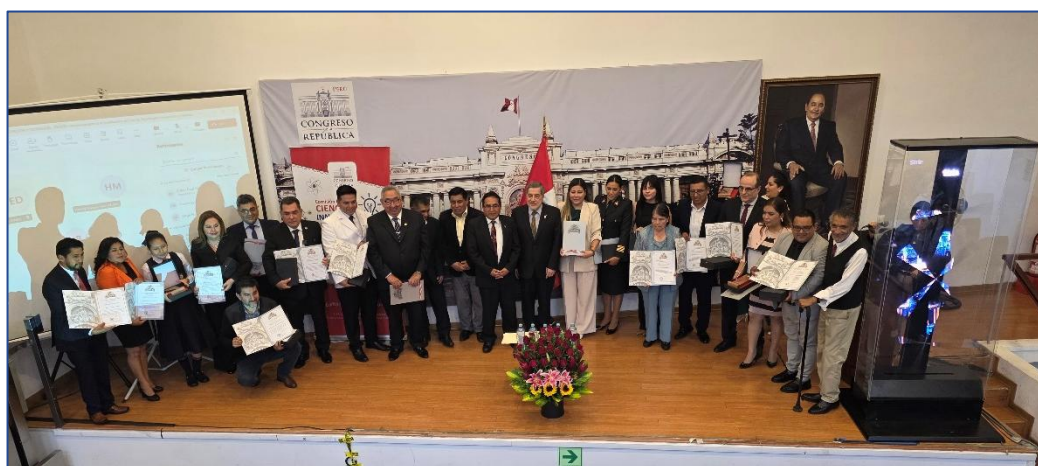
Imagen: Reconocimiento a la Contribución en la Ciencia, Tecnología e Innovación y presentación del Libro “La Ruta hacia un Ministerio de Ciencia en el Perú” (16.05.2025)

Al cierre del evento tuvo lugar la presentación oficial del libro “La Ruta hacia un Ministerio de Ciencia en el Perú” , el cual representa una contribución al debate institucional sobre la necesidad de contar con una entidad ministerial dedicada exclusivamente al desarrollo científico y tecnológico de nuestro país.