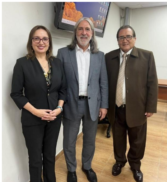
Imagen: Sesión del Grupo de Trabajo «Acción Parlamentaria sobre el Cambio Climático y Reducción de Emisiones de Metano» (16.05.2025)

En sus palabras de cierre, Susel Paredes indicó que su despacho se encargará de la sistematización de los proyectos de ley relacionados al tema que se han presentado en el Congreso y que solicitará a los 43 municipios de Lima un informe sobre el estado de sus rellenos sanitarios. Finalmente invitó a los presentes a participar en la próxima capacitación.