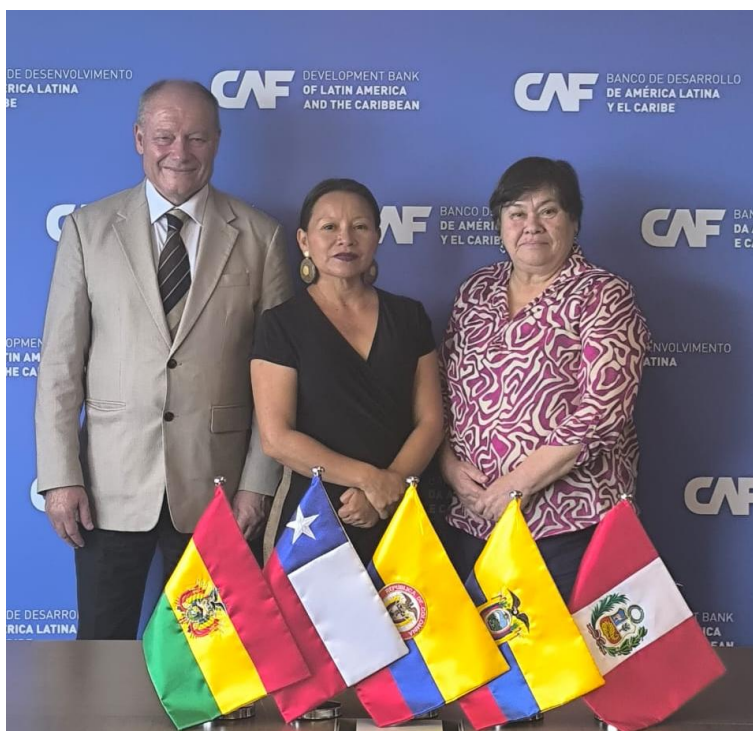
Imagen: Sesión de la Comisión Quinta de “Derechos Humanos, Desarrollo Social y Participación Ciudadana” (15.05.2025)

En el punto de proposiciones y varios, no se registraron intervenciones adicionales. Habiéndose agotado todos los temas de la agenda, se dio por concluida la sesión.