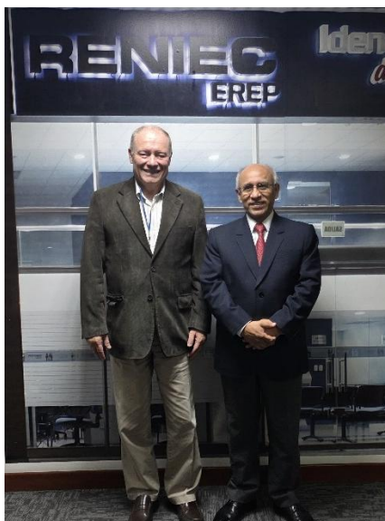
Imagen: Reunión en la Dirección de Servicios Digitales de RENIEC (27.05.2025).

4.2. Gestión de actividades relacionadas a los parlamentos juvenil y universitario y la red de universidades acreditadas.