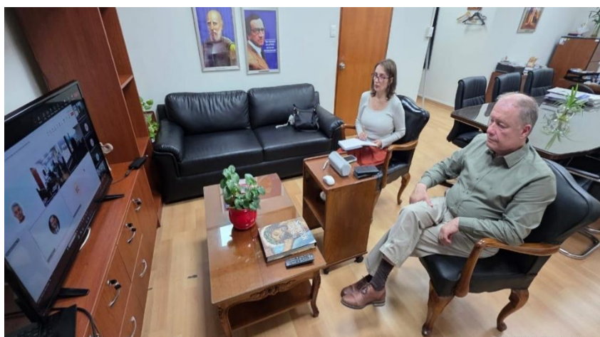
Imagen: Participación virtual en reunión con la Procuraduría General de Colombia (22.05.2025).