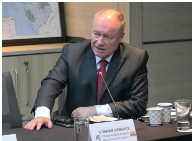
Imagen: Intervención respecto al contexto global (16.05.2025).