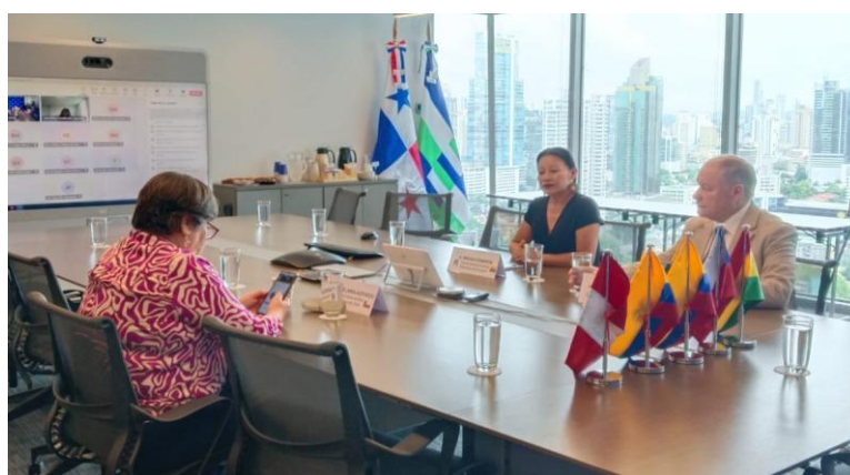
Imagen: Debate sobre la actualización del Marco Normativo para la Promoción y Protección de los Adultos Mayores en la Región Andina (15.05.2025)

Acto seguido, se retomó el debate sobre la actualización del Marco Normativo para la Promoción y Protección de los Adultos Mayores en la Región Andina , instrumento que tiene por objeto impulsar políticas y programas orientados a garantizar una atención integral y oportuna para las personas adultas mayores. Asimismo, busca asegurar su acceso a servicios de salud integral, así como su inclusión y participación en el ámbito político, económico, social, recreativo y cultural de la sociedad a las que pertenecen, sin ningún tipo de discriminación. Todo ello con el fin de promover un envejecimiento activo y saludable que mejore y mantenga su calidad de vida en todos los órdenes sociales.