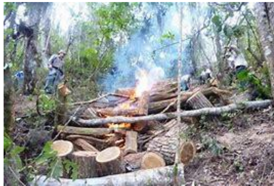
Imagen: Tala Ilegal

Menciona también que mediante la Recomendación No. 533 del 29 de noviembre de 2024, el Parlamento Andino adoptó el Marco Normativo para el Combate al Tráfico Ilegal de Fauna Silvestre en la Región Andina, como instrumento orientador de políticas públicas regionales. Y que el artículo 1 establece como objeto contribuir a combatir el tráfico ilegal de fauna silvestre en la región andina, mediante estrategias que contemplen la conservación de la fauna y sus hábitats, así como el respeto de los derechos, deberes y obligaciones de las personas involucradas en su protección, incorporando enfoques transversales como la interculturalidad, la territorialidad y el género.