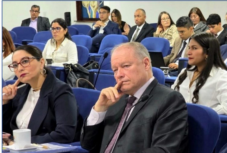
Imagen: Lectura de Informes en la sesión Plenaria (19/06/2025)

Se aprobó que la Comisión Especial de Derecho Comunitario se aboque a la organización del IV Congreso Mundial de Derecho Comunitario, a realizarse en la sede de la Secretaría General de la Comunidad Andina (CAN), en la que se debatirá los desafíos futuros de la integración mundial. Dicho congreso tomará lugar en el marco de las sesiones ordinarias del 29 de julio al 02 de agosto en Lima, Perú.