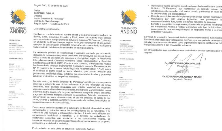
Imagen: Saludo a la Iniciativa de Conservación Ambiental Desarrollada por el Jardín Botánico “El Perezoso” en la Región Junín, República del Perú

Cabe precisar que este pedido fue acogido por la Mesa Directiva aprobándose su firma.