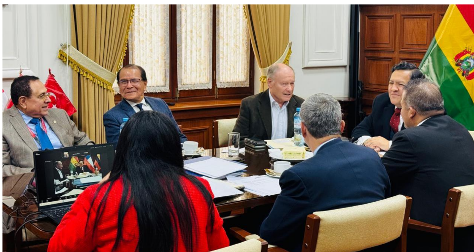
Imagen: Sesión de la Representación Nacional del Parlamento Andino (09.06.2025)

No habiendo más puntos en la agenda, se procedió a levantar la sesión.