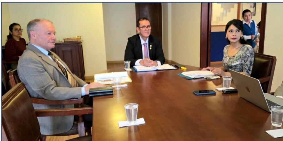
Imagen: Sesión de la Comisión Quinta de “Derechos Humanos, Desarrollo Social y Participación Ciudadana” (18.06.2025)

Finalmente, en el punto de proposiciones y varios, se acordó la importancia de incorporar expertos en materia legal que puedan precisar aspectos clave del proyecto normativo, especialmente en lo referido a las pensiones de los adultos mayores.