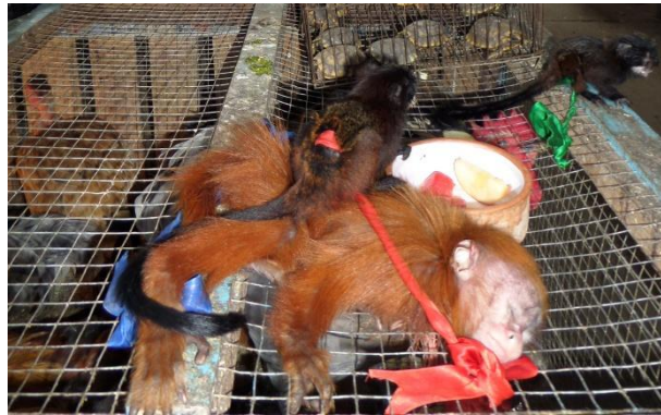
Imagen: Tráfico Ilegal de Fauna Silvestre

Después de incorporar dichas sugerencias la circular quedará lista para su firma y emisión a las entidades del gobierno colombiano que tienen competencias directas e indirectas sobre la materia, con lo cual se da un importante primer paso para la implementación de la Recomendación del Parlamento Andino, elaborada por mi despacho.