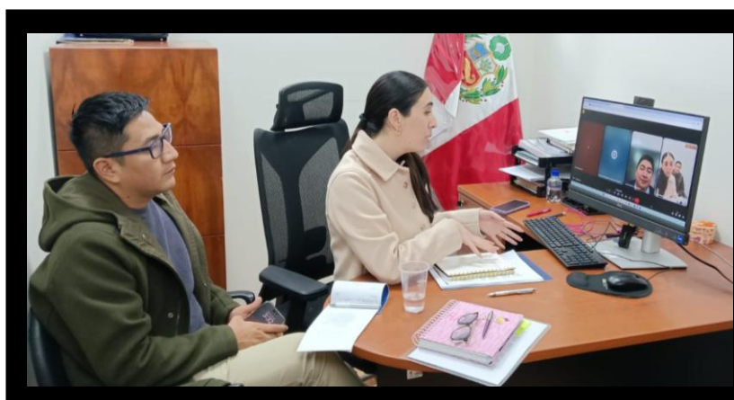
Imagen: Exposición de información sobre la Red Andina de Universidades y el Parlamento Andino Universitario (27.06.2025)

Por otro lado, mi equipo de asesores le informó también sobre el Parlamento Andino Universitario, modelo de participación juvenil impulsado desde 2014 en más de 60 universidades de la región. Esta iniciativa busca formar a jóvenes en liderazgo político, compromiso democrático e integración regional, replicando la estructura y funcionamiento del Parlamento Andino. Los estudiantes participan en cursos virtuales, eventos internacionales, formulación de propuestas legislativas, pasantías, becas y concursos académicos.