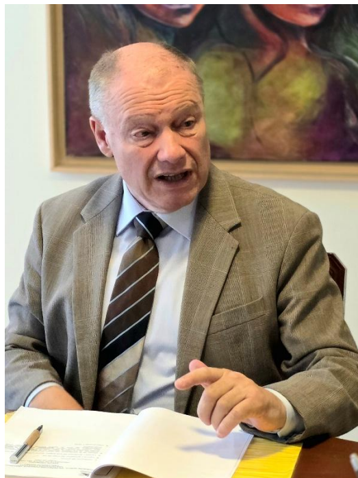
Imagen: Intervención en la Sesión de la Comisión Quinta de “Derechos Humanos, Desarrollo Social y Participación Ciudadana” (18.06.2025)

En este espacio, se compartieron las normativas vigentes en cada uno de los países miembro, resaltando la importancia de fortalecer el bienestar, la protección y la participación activa de las personas adultas mayores en la sociedad.