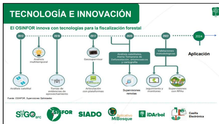
Imagen: presentación del Sr. Williams Arellano jefe de OSINFOR.(25/06/2025)

implementación del SIADO Región y el fortalecimiento del sistema SIGOSFC adoptado ya por más de 60 países.