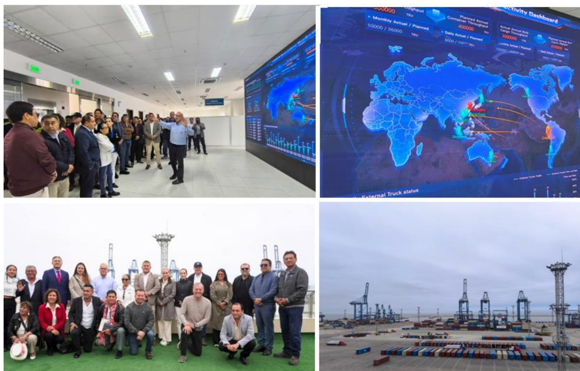
Imagen: Recorrido por las instalaciones del Megapuerto de Chancay (04.06.2025)

Tras la presentación, realizamos un recorrido por las instalaciones, donde se nos explicó parte de los procesos operativos y logísticos que allí se realizan.