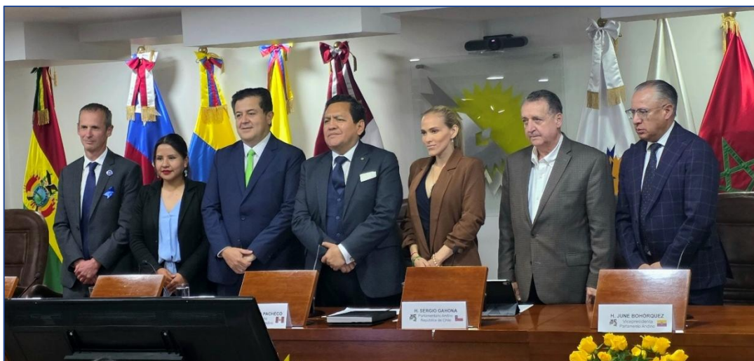
Imagen: Acto protocolar en conmemoración del Día Internacional del Refugiado durante la sesión Plenaria del Parlamento Andino (20.06.2025)