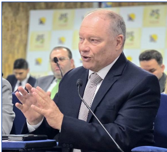
Imagen: Intervención en la exposición sobre Ciberseguridad y Ciberdefensa durante la sesión Plenaria del Parlamento Andino (20.06.2025)

de denegación de servicio. Explicué las modalidades de hackeo como el "Denial of Service", que consiste en llevar al servidor al nivel de colapso por requerimientos simultáneos y liberarlo únicamente contra un pago en Bitcoins. Mencioné también la necesidad de utilizar una VPN (red privada virtual) para una navegación segura en estos entornos.