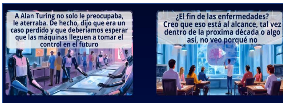
Imagen: Vistas de la sección PREDICCIONES en la página WEB del Parlamento Andino.

Ambos videos se encuentran disponibles en el sitio web oficial de la Comisión Especial de Futuro: www.parlandinofuturo.com .