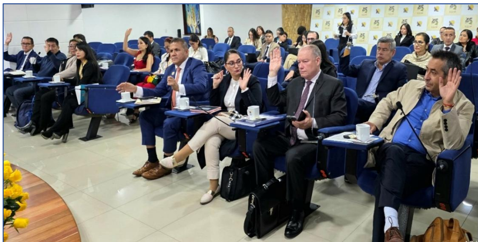
Imagen: Votación del informe de la Comisión Quinta durante la sesión Plenaria del Parlamento Andino (19.06.2025)

Tras la lectura del informe, intervine para destacar la importancia de las actividades en el campo como factor beneficioso para este grupo etario. Asimismo, señalé que gracias a las herramientas actuales con inteligencia artificial, es posible fomentar la participación de este grupo etario en la sociedad desde una perspectiva laboral.