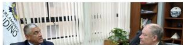
Web Perú Informa