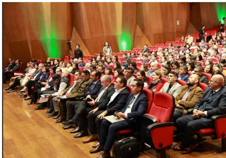
Imágenes: Acto académico “Súmate al desafío por los bosques”, OSINFOR. (25.06.2025)

Entre los principales aspectos destacados durante el evento se encuentran: