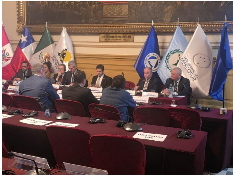
Imagen: Ponencia sobre el proteccionismo económico en el marco de la Sesión de la Comisión de Asuntos Económicos, Financieros y Comerciales de la Asamblea Parlamentaria Euro-Latinoamericana (02.06.2025).

Por otro lado, mencioné que otro tema central es el poblacional. La humanidad, en efecto, se ha duplicado en cuarenta años, lo cual no es sostenible. Por ello, destacué mi coincidencia con el postulado del Partido Comunista Chino que determina que se debe avanzar hacia una sociedad modestamente acomodada. El consumo desmedido agota el Planeta.