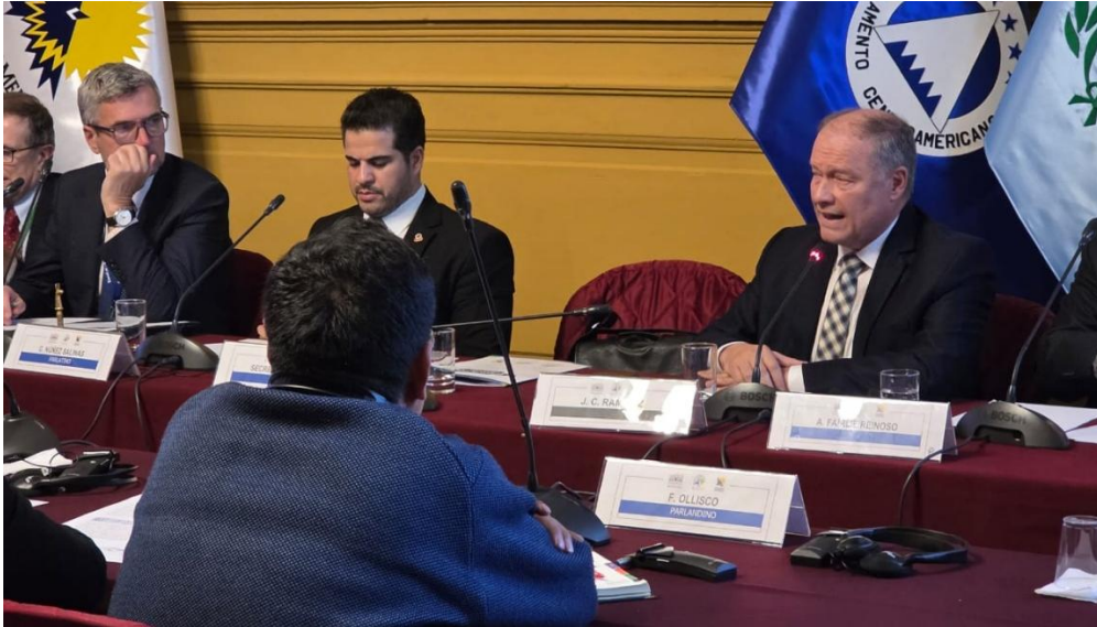
Imagen: Sesión de la Comisión de Asuntos Económicos, Financieros y Comerciales de la Asamblea Parlamentaria Euro-Latinoamericana (02.06.2025).

Concluí que el mundo ya está interrelacionado, por lo que poner barreras no funciona y solo ocasiona perjuicios a la propia industria de los países.