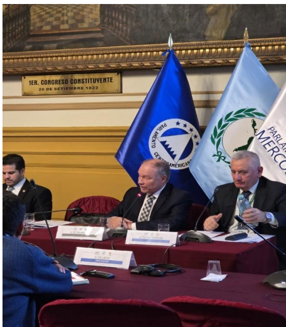
Imagen: XVI Asamblea Parlamentaria Euro-latinoamericana - EUROLAT - (02.06.2025)

En dicha sesión, ofrecí una ponencia sobre el proteccionismo económico en la Unión Europea y América Latina, en la que inicié comentando que no se trata de un tema nuevo (lo practicaban los griegos, los romanos, los fenicios, entre otros), ya que la tendencia es a proteger a las personas, sus empleos y la producción.