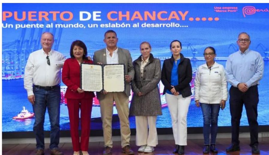
Imagen: Entrega de la Resolución que reconoce al Chancho al Palo, como referente gastronómico y patrimonio cultural de la región andina. (04.06.2025)