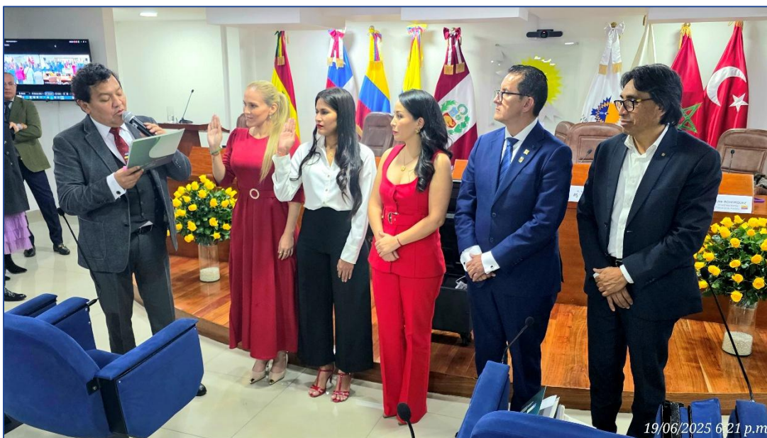
Imagen: Toma de posesión de los Parlamentarios Andinos por la Representación Parlamentaria Nacional del Ecuador, durante la sesión Plenaria (19.06.2025)

Hacia el final de la sesión, tomó lugar en un acto protocolar, la juramentación de la nueva representación de la República del Ecuador.