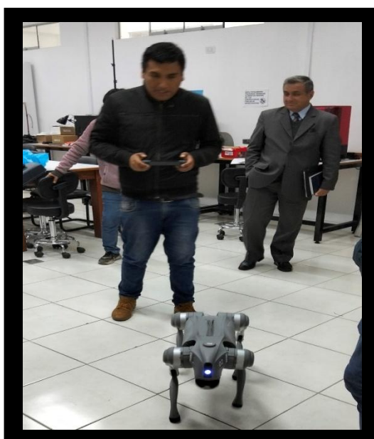
Imagen: Visita a los laboratorios de la UNTELS (09.06.2025)

Finalmente, se precisó que desde mi despacho se continuará impulsando el uso estratégico de la ciencia y la tecnología como herramientas clave para mejorar la calidad de vida de la ciudadanía y fortalecer la gobernanza pública en los países de la región andina. En ese marco, se invitó a la UNTELS a sumarse a las iniciativas y actividades que se desarrollen en esta línea de trabajo conjunto.