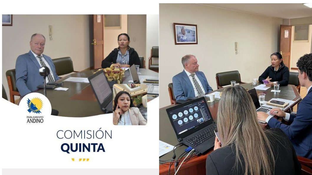
Imágenes: Sesión de la Comisión Quinta de "Derechos Humanos, Desarrollo Social y Participación Ciudadana" (25.09.2024)

Una vez terminado este punto, y no habiendo más por revisar, se dio por terminada la sesión.