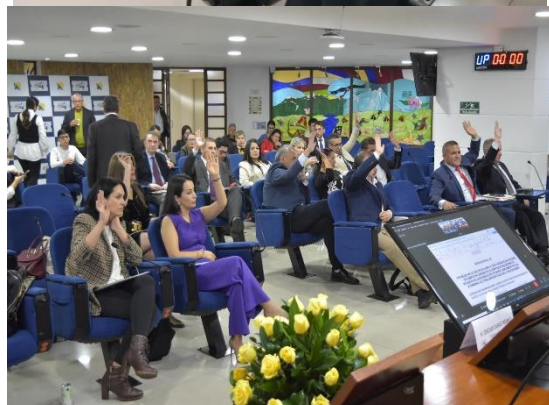
Imágenes: sesión de la Plenaria de setiembre (26/09/2024)