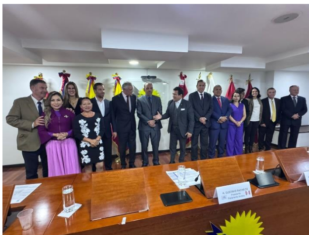
Imagen: Clausura de la sesión Plenaria (26/09/2024)

Concluida la charla, se levantó la sesión.