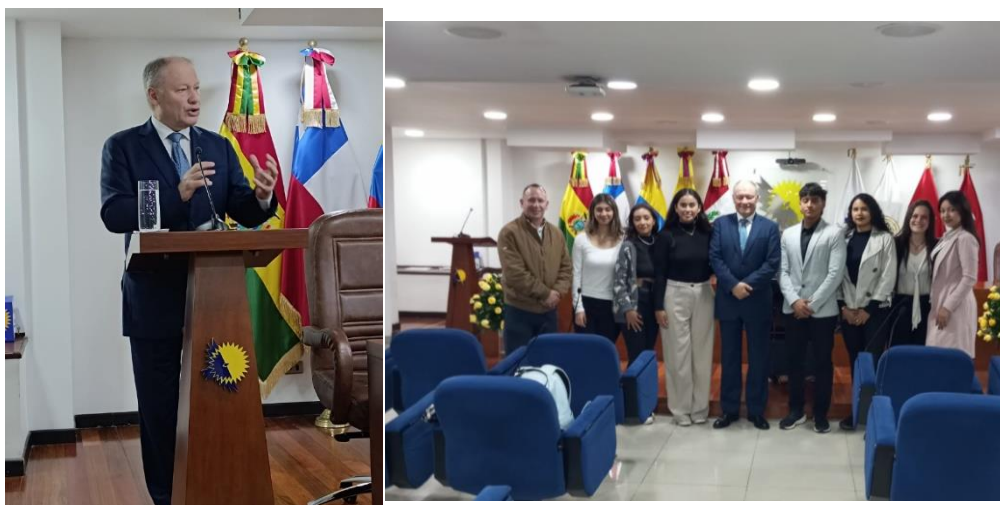
Imágenes: Charla académica para los parlamentarios juveniles y universitarios (28/09/2024)

nosotros, sino hacia nosotros mismos. Un ejemplo es el Número de Avogadro , eso se llama iluminación. El futuro no importa, mantenerse juntos para enfrentarlo, cualquiera que sea el futuro, esa es la respuesta.