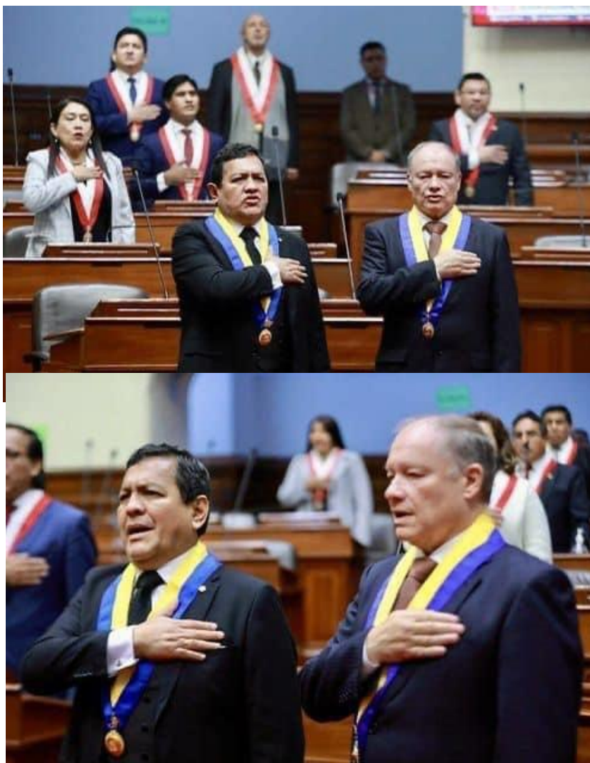
Imagen: Participación en la sesión solemne por el aniversario del Congreso del Perú (20.09.2024)

El 20 de setiembre participé de la Sesión solemne realizada en el marco de las actividades organizadas en conmemoración del aniversario N° 202 del Congreso de la República del Perú.