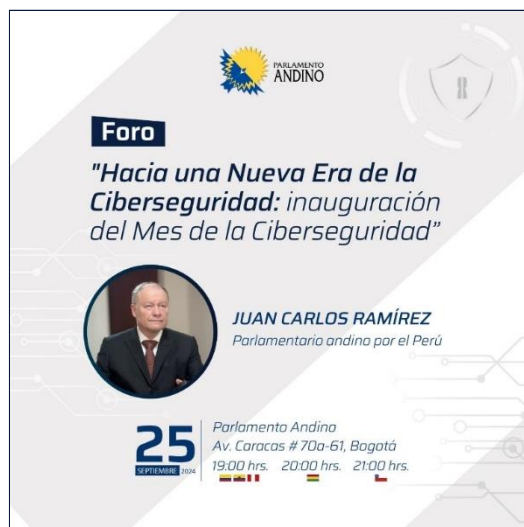
Imagen: Evento Hacia una nueva era de la ciberseguridad (25/09/2024)

esencial desde su fundación en el 2001, para la divulgación y formación en ciber seguridad y hacking ético en Colombia y a nivel internacional.