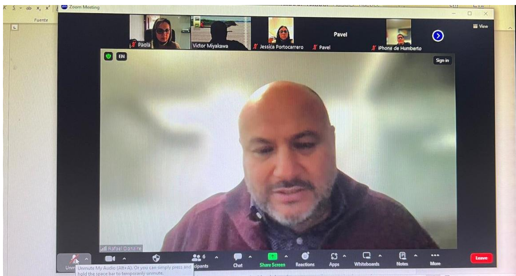
Imagen: Reunión virtual de coordinación con ILAT (18/09/2024)

Se discutieron temas de organización (como la realización de las reuniones protocolares presenciales y las reuniones técnicas virtuales), algunos temas técnicos que pasaron por las propuestas de acotar los temas y desarrollar al menos dos notas conceptuales para la búsqueda de financiamiento antes del taller, la definición de actores que se van a priorizar, entre otros.