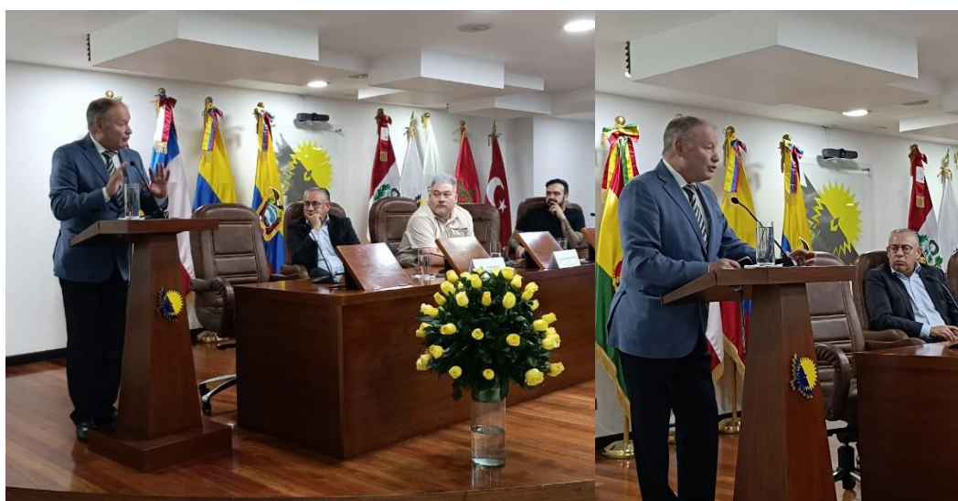
Imágenes: Discurso apertura evento Hacia una nueva era de la ciberseguridad (25/09/2024)

También puntualicé que, en el contexto de normatividad y regionalización, y tomando como antecedente la aprobación en el 2020 del Marco normativo para el fortalecimiento de la ciberseguridad en la región Andina, se llevan a cabo una serie de esfuerzos para construir una infraestructura que nos brinde capacidad para la detección y respuesta rápida ante ataques cibernéticos. Solo de esta manera podremos asegurar la continuidad de servicios esenciales como la energía, el agua y la salud pública, protegiendo a los ciudadanos de toda nuestra región.