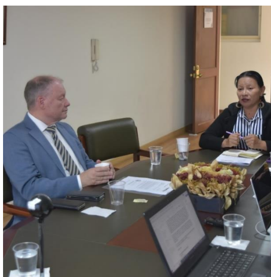
Imágenes: Debate y aprobación del proyecto de Marco normativo sobre malnutrición infantil (25/09/2024)