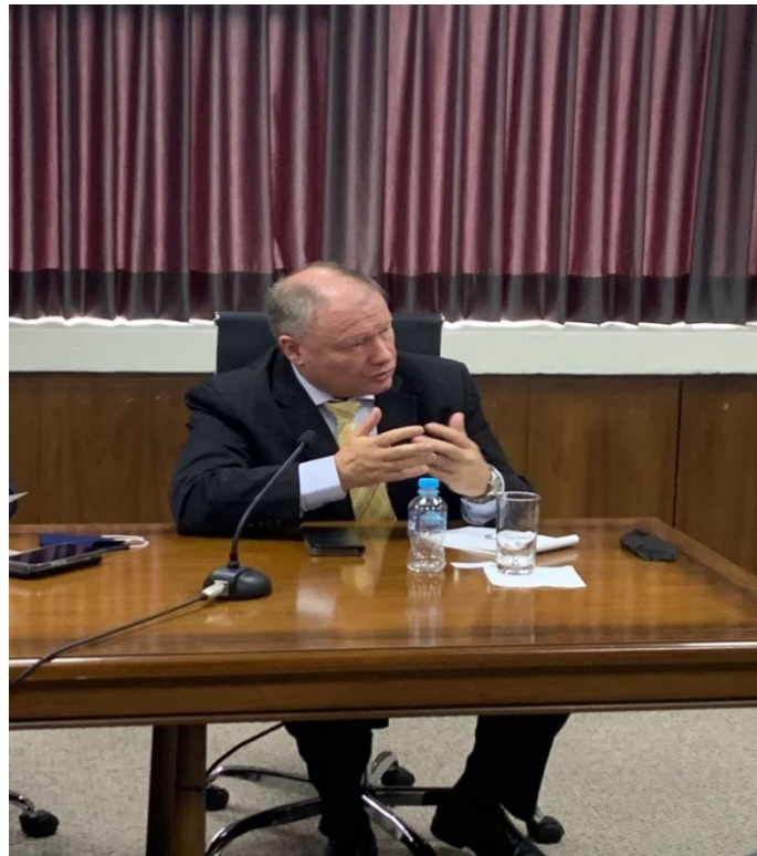
Imagen 5 (30/09/2021). Participación durante reunión en la Organización Latinoamericana de Energía (OLADE)

Por último, se expresó el compromiso y apoyo para el desarrollo del Seminario Internacional de Eficiencia Energética programado para el primer semestre del año 2022 en el Perú.