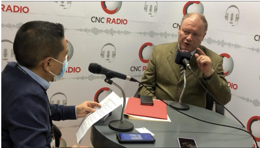
Imagen 17 (13/09/2021). Entrevista en CNC Radio