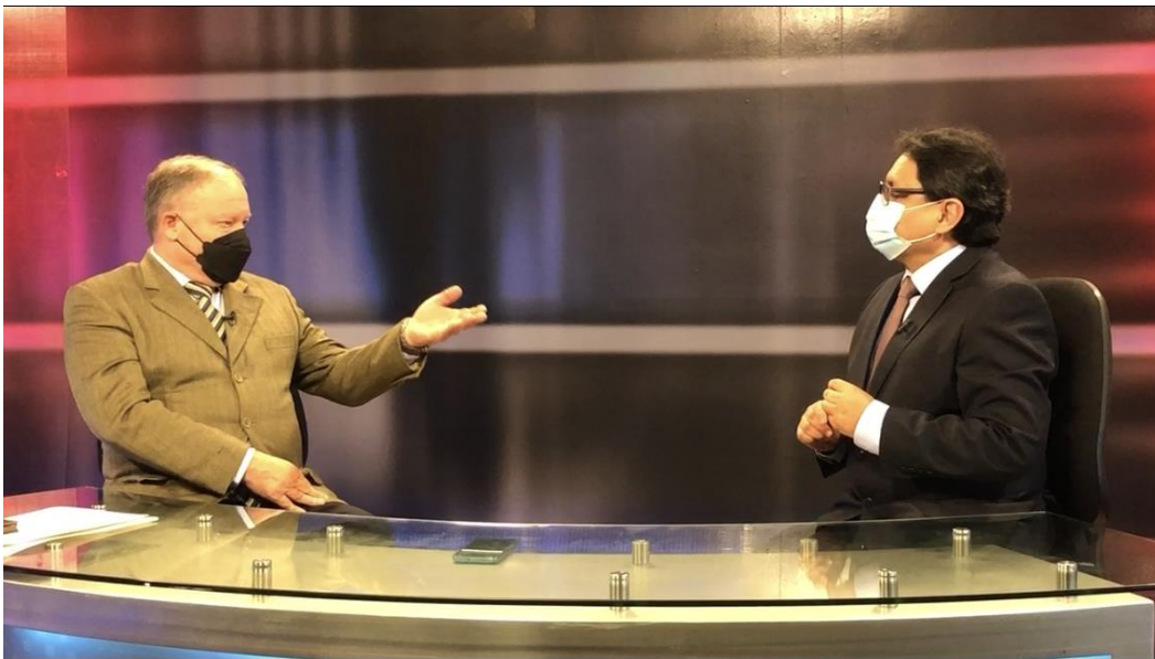
Imagen 16 (13/09/2021). Entrevista en Canal del Congreso (TV Congreso)

Sobre la distribución del agua en el país, precisamos que el 97% del agua del Perú se va al océano atlántico, el 2.7% al pacífico y 0.3% al lago Titicaca. “El 97% se va a la selva y lo que tenemos que hacer es recuperar esa agua” . En ese sentido, señalamos que se han comenzado a analizar las leyes para dicho propósito.