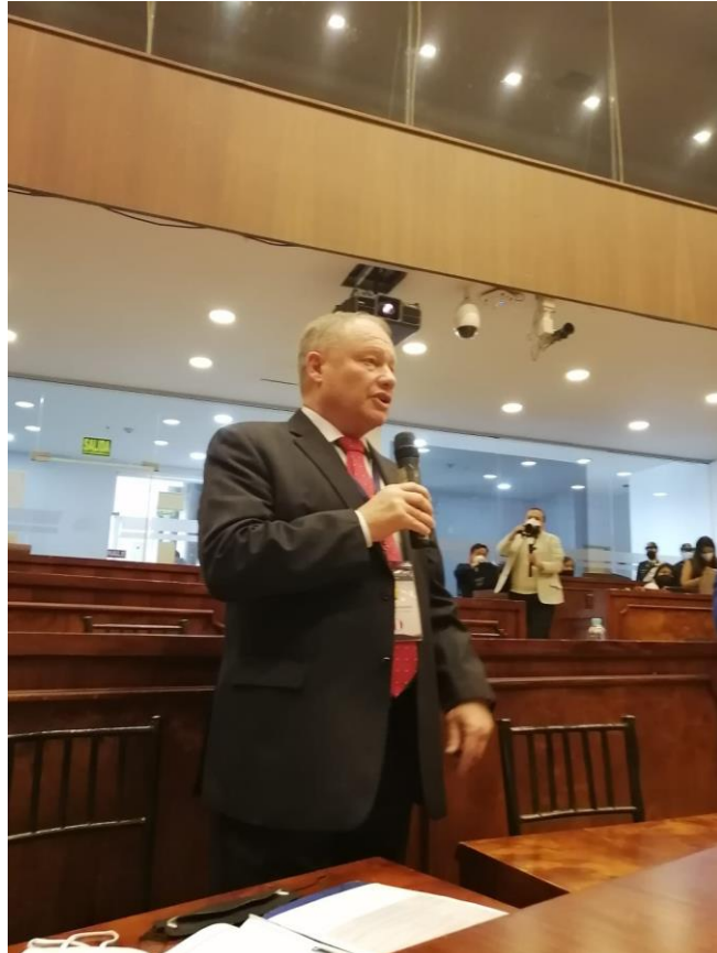
Imagen 2 (28/09/2021). Participación en debate de la propuesta de Marco Normativo para la Estrategia Andina de Seguridad Hídrica

Ante esta preocupante situación, anotamos que los sembríos de arroz y la demanda de agua de los pastos para ganado son muy intensivos en el consumo de agua. Asimismo, expresamos y planteamos la necesidad de tomar acciones para que nuestros países adopten un sistema de uso de agua más racional que permita reducir su consumo intensivo, elemento que consideramos debe formar parte de este Marco Normativo.