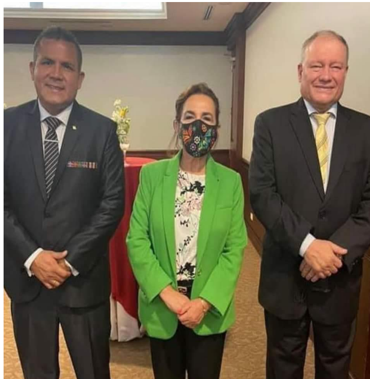
Imagen 11 (30/09/2021). Conversación con Dra. Elvia Barrios, Presidenta del Poder Judicial del Perú