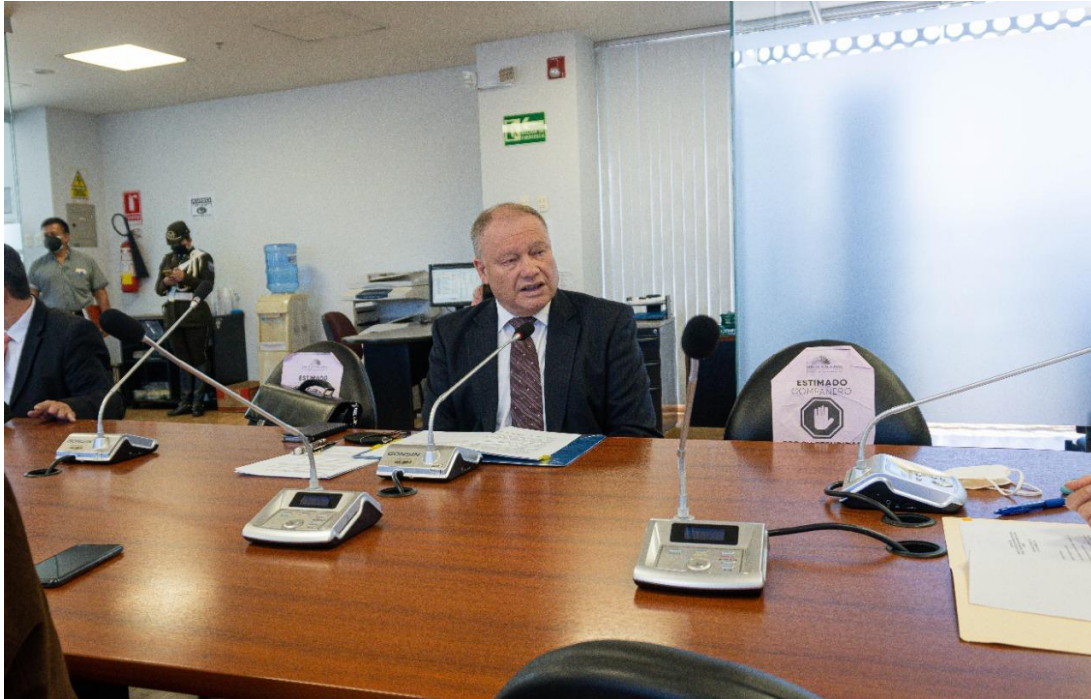
Imagen 1 (27/09/2021). Participación en Sesión de la Comisión Cuarta, durante debate de Norma Comunitaria para promover la inversión extranjera

Asimismo, se señaló que la base central para una adecuada defensa jurídica de los países andinos en materia de inversiones debe ser la redacción de un buen contrato. Un contrato con reglas claras sobre las obligaciones de los inversionistas y del Estado, permitirá proteger mejor los recursos económicos de nuestros países en caso de presentarse controversias que se sometan a instituciones arbitrales.