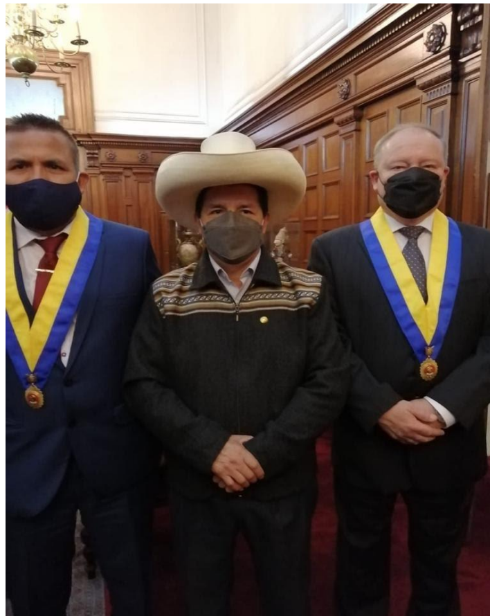
Imagen 9 (16/09/2021). Reunión con el Presidente de la República, Pedro Castillo, en la Conmemoración del 199° Aniversario del Congreso de la República

Entre los invitados a dicho evento estuvieron el Presidente de la República Pedro Castillo Terrones, el entonces Presidente del Consejo de Ministros, Guido Bellido, el Vicepresidente del Parlamento Andino por el Perú, Fernando Arce, entre otros invitados.