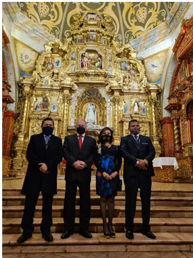
Imagen 10 (27/09/2021). Visita a la Iglesia Santo Domingo de Guzmán, junto a los colegas de la representación parlamentaria peruana

La conservación de esta Iglesia y sus expresiones culturales es muy importante para los países andinos. Para tal fin, sus administradores solicitaron el apoyo del Parlamento Andino a través de normas que promuevan su protección y cuidado.