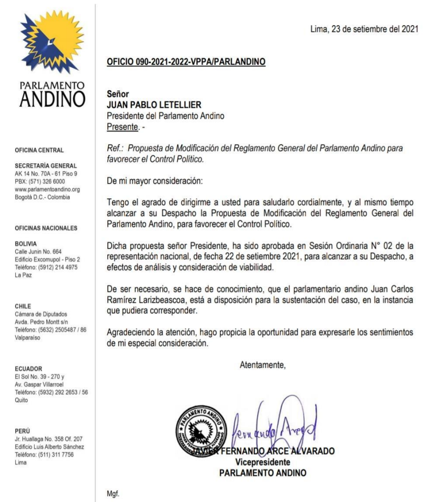
Imagen 14 (23/09/2021). Remisión de propuesta normativa a la Presidencia del Parlamento Andino

Luego del debate respectivo en la sesión de la Oficina de la Representación Parlamentaria de fecha 22 de setiembre, la propuesta de Decisión fue aprobada y, posteriormente, tramitada ante el Parlamento Andino para su debate y priorización correspondiente.