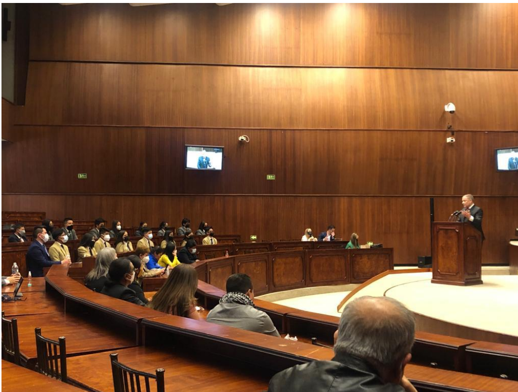
Imagen 3 (29/09/2021). Participación en Conversatorio con jóvenes líderes de Quito integrantes del Programa “Parlamento Andino Juvenil”

En el marco de esta reunión, expresamos nuestro reconocimiento a estos jóvenes líderes, a sus profesores y a sus familias, ya que todos han contribuido a su formación y conocimiento. De igual manera, se les exhortó a seguir actuando con disciplina, orden y trabajo, ya que sólo ello, sumado al conocimiento, les permitirá lograr sus objetivos, en este caso, ser importantes representantes de nuestra región andina.