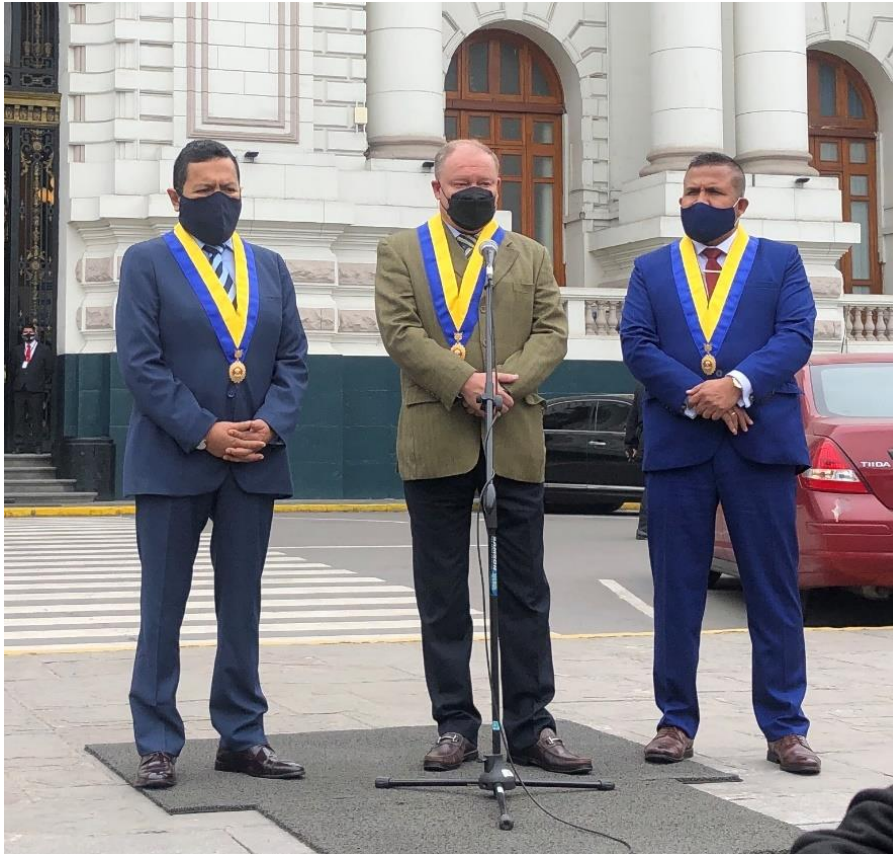
Imagen 15 (13/09/2021). Conferencia de prensa en el Congreso de la República