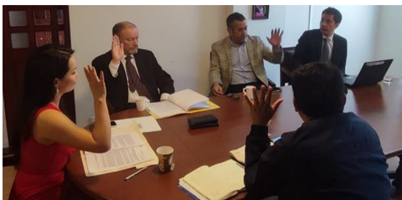
Imagen 2: Votación de la propuesta de Norma Comunitaria sobre Zonas de Integración Fronteriza (ZIF) y Acuerdos Binacionales (13.07.2023).

Los integrantes de la Comisión coincidimos en que el documento se encuentra listo para su debate en plenaria, razón por la cual fue aprobado por unanimidad.