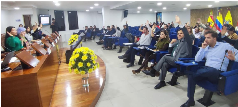
Imagen 4: Votación del proyecto de “Marco Normativo para Enfrentar la Evasión y Elusión de Impuestos que se Realiza a Través de Paraísos Fiscales, mediante el Cumplimiento Eficaz de los Estándares Internacionales”. (13.07.2023)

del Marco Inclusivo sobre el proyecto BEPS de la OCDE respecto a una profunda reforma de las normas tributarias internacionales.