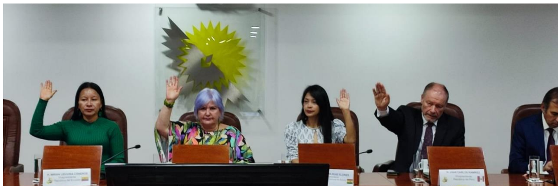
Imagen 3: Votación de los informes de Comisiones Permanentes (13.07.2023)

Posteriormente, procedimos a debatir y votar aquellos proyectos normativos que fueron trabajados, analizados y aprobados previamente por las Comisiones. De ese modo la Plenaria aprobó por unanimidad los siguientes documentos: