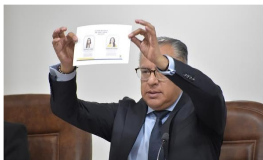
Imagen 5: Presentación de la cédula de sufragio. (14.07.2023)