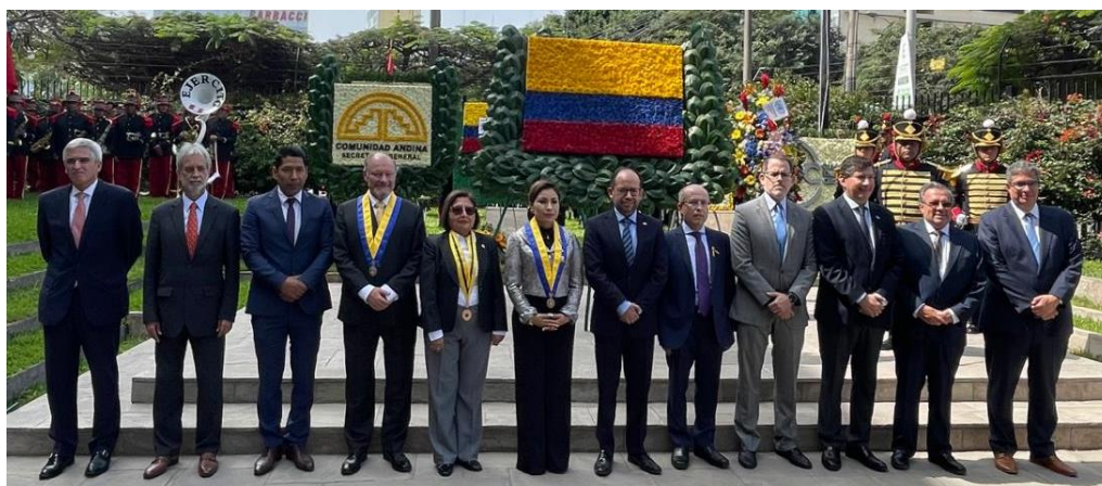
Imagen 11 (21/07/2023). Foto protocolar con autoridades invitadas al evento de Conmemoración.

Finalmente, tuvieron lugar las palabras conmemorativas y de agradecimiento por parte del secretario general interino de la CAN, seguido por el encargado de negocios interino de Colombia en el Perú.