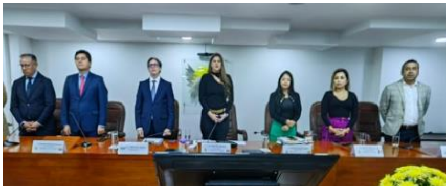
Imagen 8: Instalación de la nueva Mesa Directiva. (14.07.2023)

Luego de la juramentación de los nuevos integrantes de la Mesa Directiva, estos tomaron posesión e iniciaron la sesión vespertina de la Plenaria, en la cual se presentó el informe de la Mesa Directiva, el mismo que fue aprobado por unanimidad.