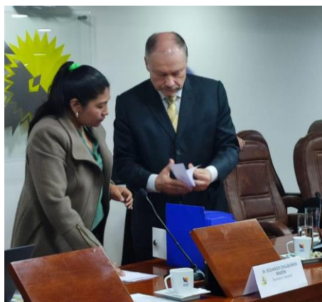
Imagen 6: Proceso de Escrutinio de las cédulas de sufragio. (14.07.2023)