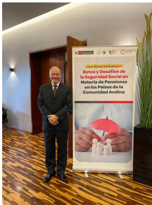
Imagen 12: Evento Retos y desafíos de la Seguridad Social en Materia de Pensiones en los países de la Comunidad Andina . (06.07.2023)

El foro contó con la participación de especialistas de Colombia, Ecuador y Bolivia, lo cual permitió tener un panorama más amplio de las problemáticas y retos de la seguridad social en la región, además de identificar políticas públicas que permitan brindar de mayor protección en materia de pensiones a los trabajadores.