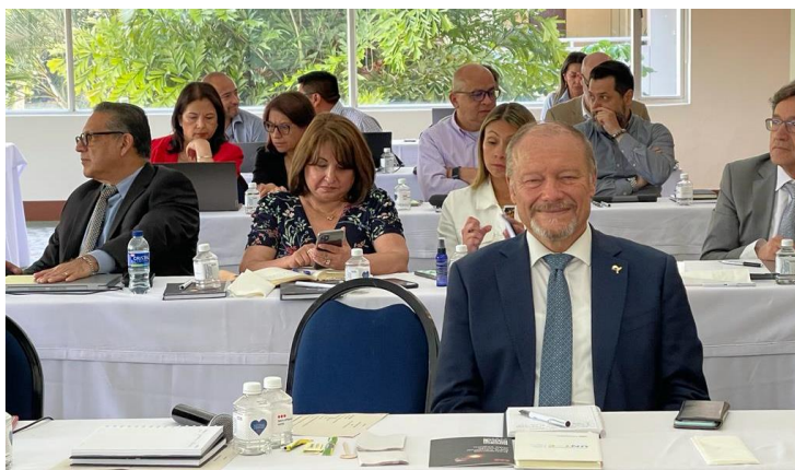
Imagen 13: Taller organizado por OACI Proyecto de desarrollo del Control de Seguridad Único - One Stop Security (OSS) en América Latina. (25.07.2023)