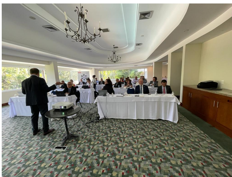
Imagen 14: Exposición del Representante de OACI – One Stop Security (OSS) en América Latina. (25.07.2023)