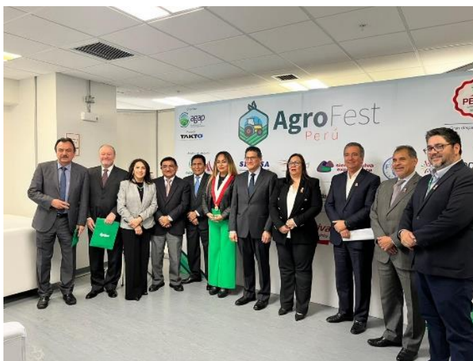
Imagen 12: Inauguración del evento AGROFEST 2023 (06.07.2023)

Respondiendo a la invitación de la Asociación de Gremios de Productores Agrarios del Perú – AGAP-, asistí al evento Agrofest Show Perú 2023 , el mismo que contó con la participación de destacados representantes de la agricultura nacional e internacional. Este espacio de diálogo fue de utilidad para tomar conocimiento sobre los resultados, experiencias e inquietudes de este importantísimo sector productivo y fuente de empleo para un gran número de peruanos.