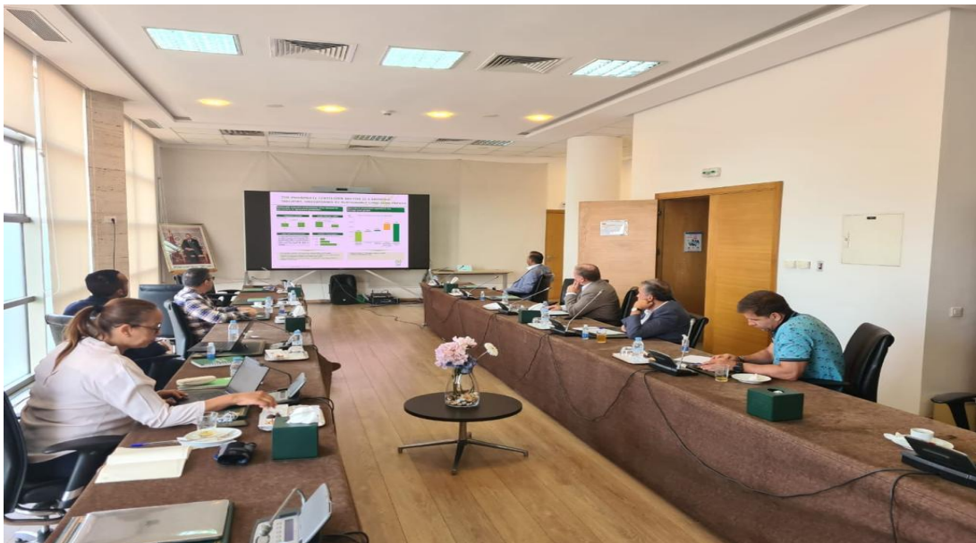
Imagen 7 (07/07/2022). Reunión con empresarios de la industria del fosfato

Se sostuvo una reunión con los ejecutivos del grupo empresarial OCP - líder mundial de la industria del fosfato, quienes expusieron sobre el desarrollo de las minas de fosfato en su país, la importancia de este recurso, la variedad de fertilizantes fosfatados (no nitrogenados) y las oportunidades de colaboración con los países del Parlamento Andino en el sector.