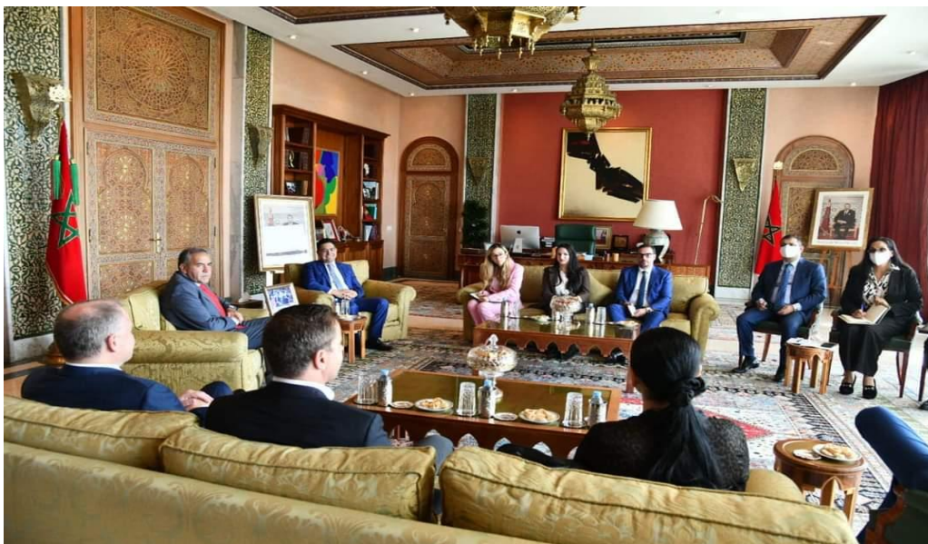
Imagen 4 (06/07/2022). Reunión con Ministro de Asuntos Exteriores del reino de Marruecos

Junto a los integrantes de la Mesa Directiva del Parlamento Andino, sostuve una reunión de trabajo con el Ministro de Asuntos Exteriores de Marruecos, Nasser Bourita, quien realizó una exposición sobre aspectos relacionados a la colaboración que puede brindar dicho país en proyectos de interés y beneficio para los países de la Comunidad Andina.