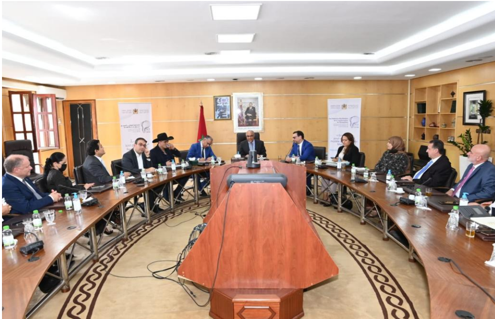
Imagen 6 (06/07/2022). Reunión con Director de Universidades y Escuelas Superiores de Marruecos

Parlamento Andino y Marruecos para compartir experiencias educativas y culturales diferentes.