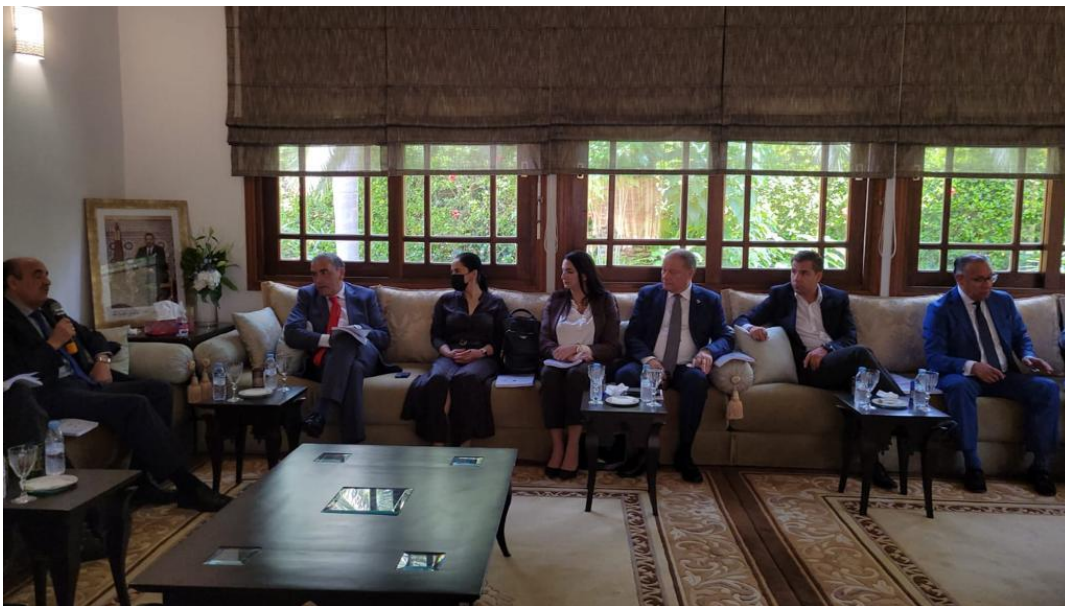
Imagen 5 (06/07/2022). Reunión con Consejero Real de los asuntos del Sahara

Asimismo, se realizó una exposición sobre los lugares donde se encuentran ubicados los recursos y minas de fosfato en su país y la región del Sahara.