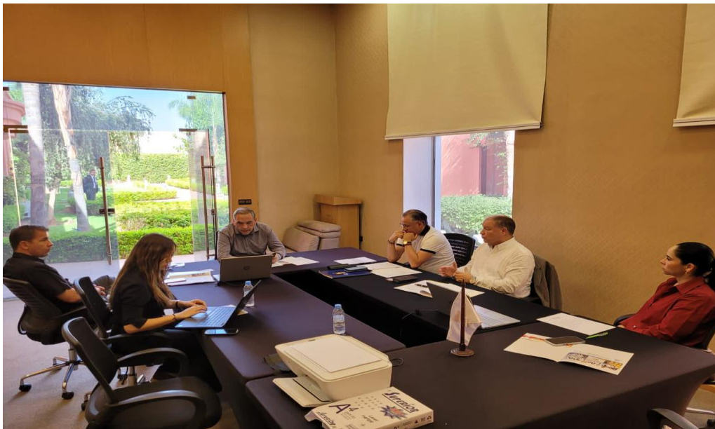
Imagen 1 (03/07/2022). Sesión de Mesa Directiva

En el marco de dicha sesión, se aprobaron las actas de la sesión ordinaria y la sesión extraordinaria del mes de junio, así como la agenda del periodo de sesiones extraordinario del mes de julio, en el cual se nombrará al Presidente y los Vicepresidentes del Parlamento Andino, así como de las Comisiones.