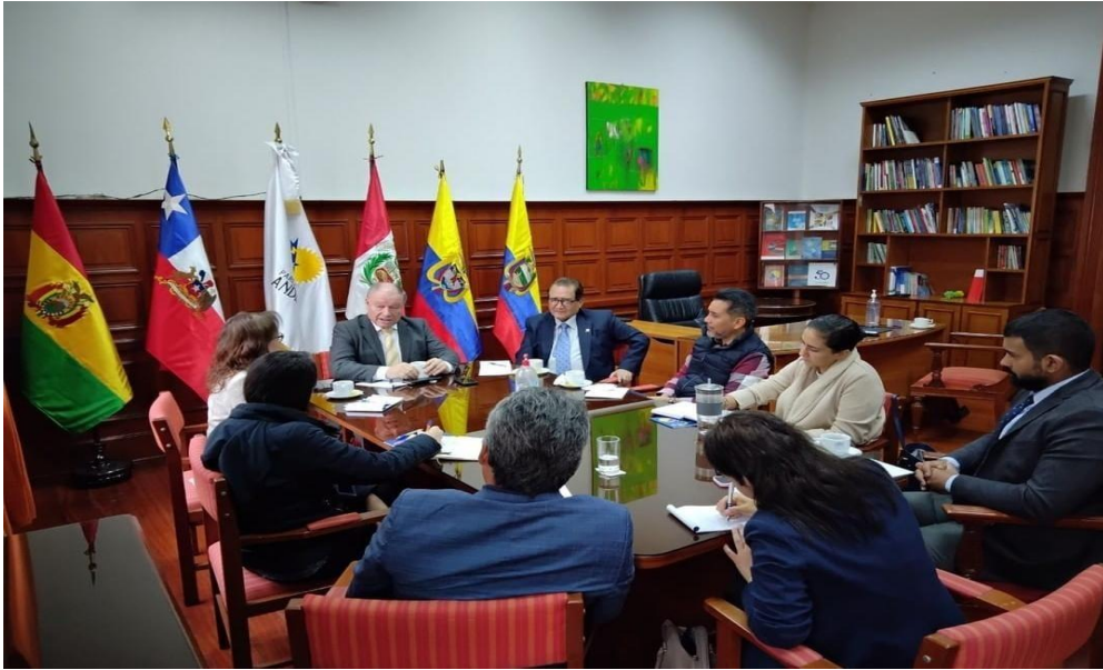
Imagen 9 (15/07/2022). Reunión con representantes de UNODC