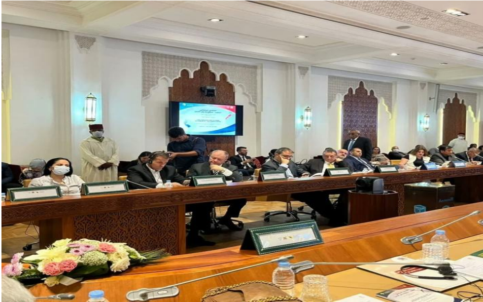
Imagen 3 (05/07/2022). Foro parlamentario de Cooperación Económica e Intercambio Comercial