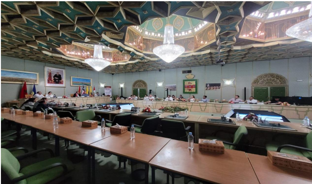
Imagen 2 (04/07/2022). Sesión plenaria en Laayoune

Respecto a la propuesta de Norma Comunitaria para la prevención del embarazo adolescente en la región Andina, se informó que el debate se postergará por la ausencia de la parlamentaria ponente.