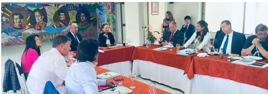
Imagen: Sesión conjunta de la Comisión Primera y Quinta del Parlamento Andino (25.02.2025)

Se acordó que la Secretaría envíe un borrador a los parlamentarios con todas las observaciones incorporadas y se debata posteriormente en la sesión Plenaria.