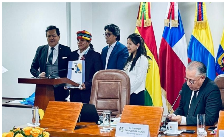
Imagen: Firma de Cartas de Adhesión a la Red Andina de Autoridades Territoriales, durante la sesión Plenaria del Parlamento Andino (25.02.2025)

Posteriormente, se procedió con la firma de Cartas de Adhesión a la Red Andina de Autoridades Territoriales de 4 alcaldes miembros de Comaga – Consorcio de Municipios Amazónicos y Galápagos, Ecuador (Santiago, Isabela, Penipe y Palora).