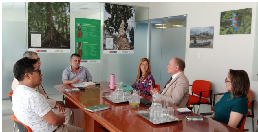
Imagen: Reunión con funcionarios de SERFOR (06.02.2025)