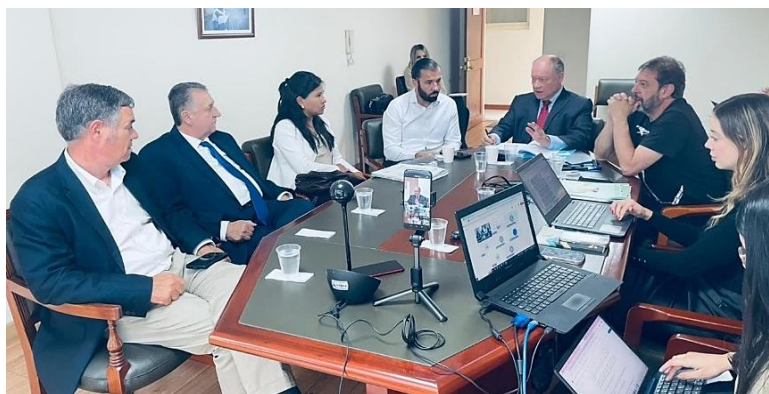
Imagen: Debate sobre los Códigos de Ética y de Acreditaciones, durante la sesión de la Comisión de Ética y Acreditaciones del Parlamento Andino (25.02.2025)