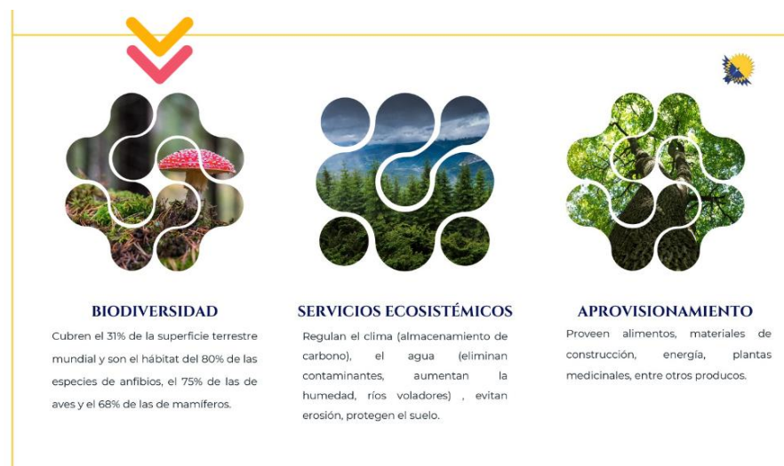
Presentación del Proyecto de marco normativo para la lucha contra la deforestación en la región Andina, durante la sesión Plenaria (26.02.2025)

Como parte de la presentación de este proyecto, se transmitió un video preparado por mi despacho que expone el contenido de la norma y luego hice una intervención para resaltar la importancia de la conservación de los bosques.