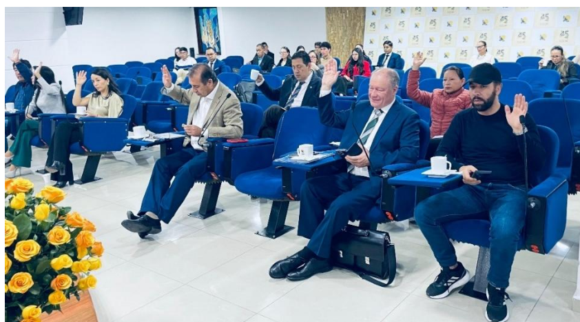
Imagen: Debate y votación de instrumentos de pronunciamiento del Parlamento Andino, durante la sesión Plenaria del Parlamento Andino (26.02.2024)