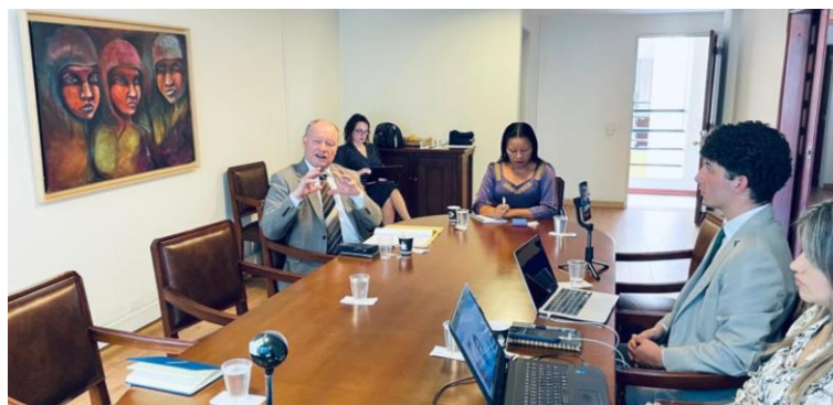
Imagen: Sesión de la Comisión Quinta del Parlamento Andino (24.02.2025)