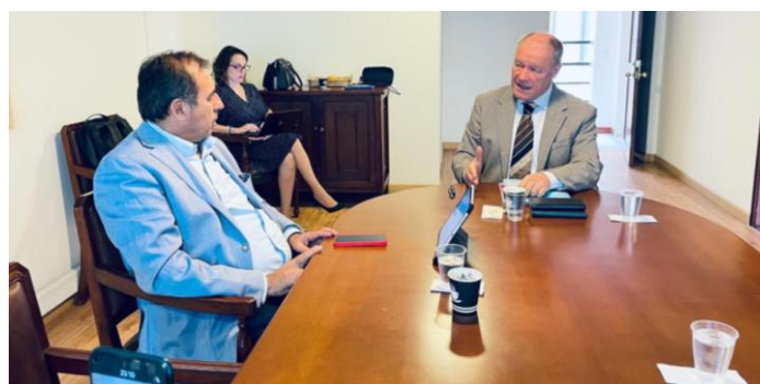
Imagen: Sesión de la Comisión Especial de Futuro del Parlamento Andino (24.02.2025)

Finalmente, respecto a la iniciativa para la realización de un evento de futuro, comenté que sería conveniente completar los miembros de la Comisión para definir fechas, temas y otras cuestiones. Solicité que se realicen las gestiones para nombrar al representante de Colombia. Además, sugerí que el evento se realice en Chile, por los avances de este país en temas de futuro.