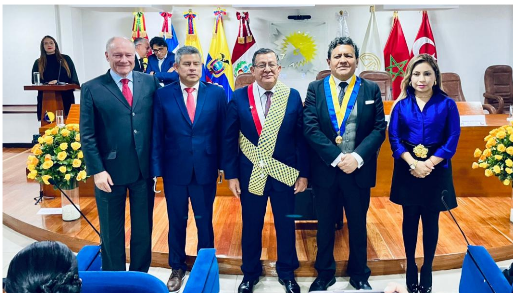
Entrega de la Condecoración Simón Bolívar a la Integración al presidente del Congreso de la República del Perú (25.02.2025)

Finalizó ratificando su compromiso como ciudadano de este conjunto de países, de trabajar por la integración y el desarrollo de nuestros pueblos.