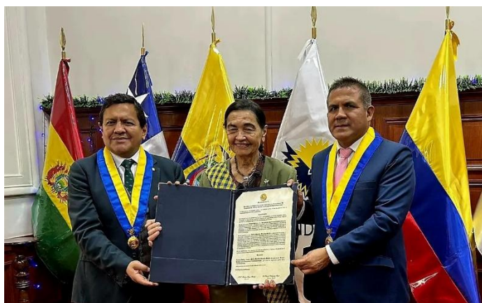
Imagen 1: Condecoración a la Dra. Ruth Shady

Mi equipo de trabajo asistió a la condecoración de la antropóloga y arqueóloga peruana Ruth Martha Shady Solís. En donde la representación nacional del Parlamento Andino reconoció su invaluable aporte al descubrimiento de la Ciudad Sagrada de Caral – Supe, así como la enorme labor realizada en la protección y salvaguarda de esta importante zona arqueológica andina, considerada como la más antigua de las Américas.