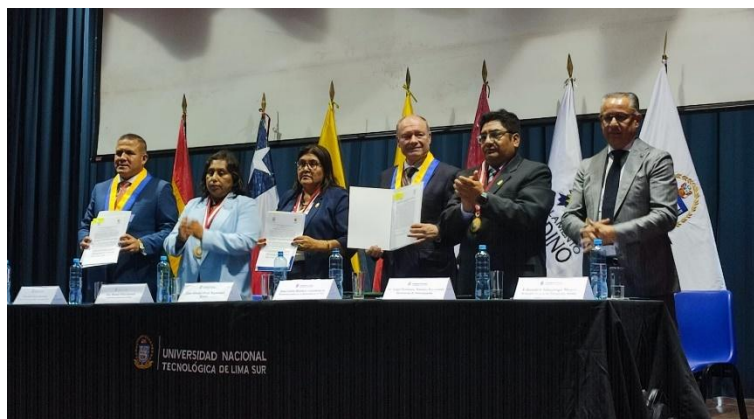
Imagen 6: Firma del Convenio Interinstitucional entre la UNTELS y el Parlamento Andino (06.12.23).

Posteriormente, sostuve una reunión técnica para exponer los alcances y ejecución del convenio de cooperación interinstitucional; y las próximas actividades que desarrollaran nuestros jóvenes parlamentarios. Por su parte, el secretario general del Parlamento Andino, precisó las acciones que se llevan a cabo en el marco de Red Andina de Universidades Acreditadas, red a la cual la UNTELS se adhirió.