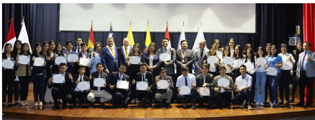
Imagen 6: Ceremonia de instalación del PAU -UNTELS (06.12.23)