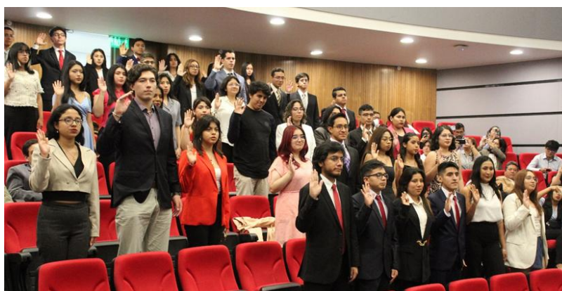
Imagen 8: Juramentación a los parlamentarios universitarios del PAU UPC (07.12.23)

Asimismo, se realizó la ceremonia de juramentación a los parlamentarios universitarios de dicha casa de estudios.