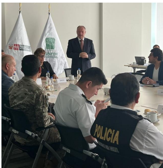
Imagen 2: Presentación del Marco normativo para la lucha contra la tala ilegal y comercio asociado en los bosques amazónicos de la región andina ante el CMLTI