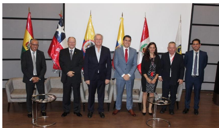
Imagen 9: Ceremonia de instalación del PAU UPC (07.12.23)