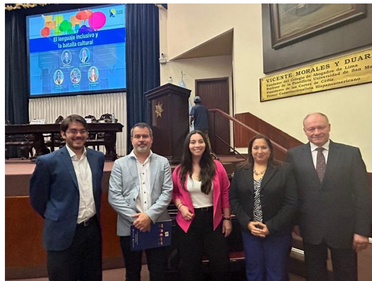
Imagen 3: Foro El lenguaje inclusivo y la batalla cultural