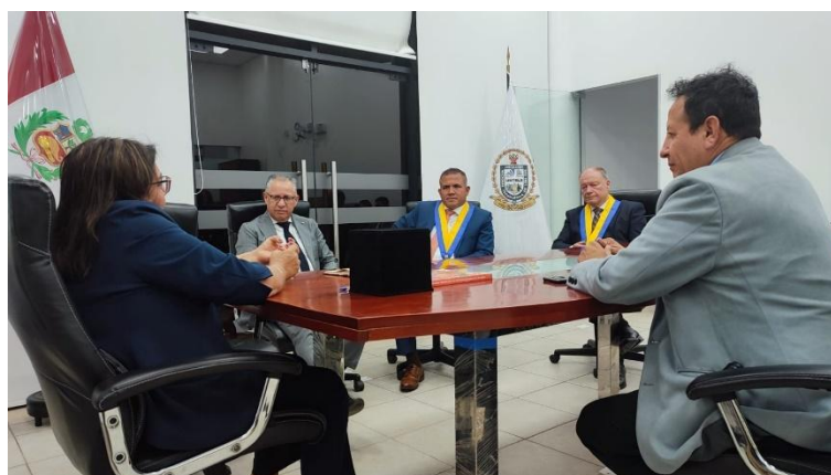
Imagen 7: Reunión técnica entre la UNTELS y el Parlamento Andino (06.12.23)

Posteriormente, sostuve una reunión técnica para exponer los alcances y ejecución del convenio de cooperación interinstitucional; y las próximas actividades que desarrollaran nuestros jóvenes parlamentarios. Por su parte, el secretario general del Parlamento Andino, precisó las acciones que se llevan a cabo en el marco de Red Andina de Universidades Acreditadas, red a la cual la UNTELS se adhirió.