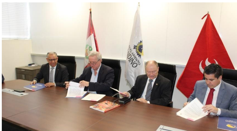
Imagen 7: Suscripción de la adhesión de la UPC a la Red Andina de Universidades Acreditadas (07.12.23)

Asimismo, se realizó la ceremonia de juramentación a los parlamentarios universitarios de dicha casa de estudios.