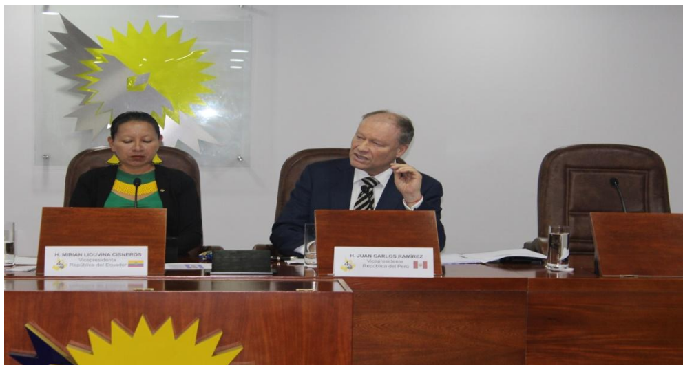
Imagen 3 (18/11/2022). Intervención durante debate de Recomendación sobre situación de migrantes

Finalizado el debate, la propuesta de Declaración fue aprobada por mayoría, con mi voto en contra.