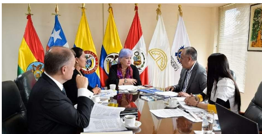
Imagen 1 (17/11/2022). Sesión de Mesa Directiva