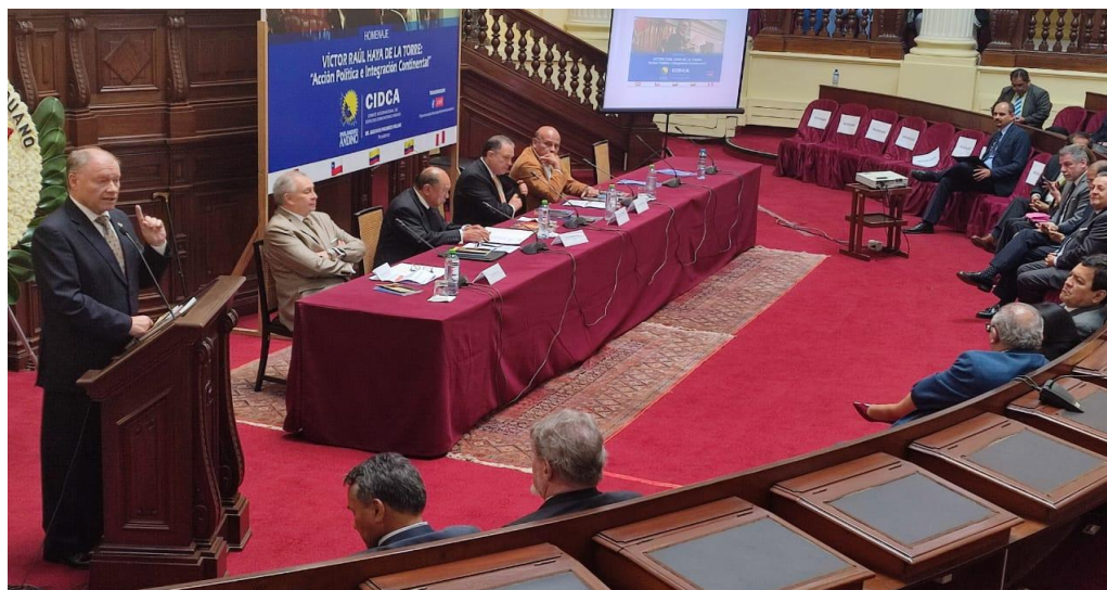
Imagen 5 (24/11/2022). Homenaje a Víctor Raúl Haya de la Torre

Esta vocación también se puede observar en la fundación del Partido Aprista en México, el cual fue concebido como Alianza Americana, pensamiento visionario que hoy se traslada, por ejemplo, a Instancias Internacionales como la Comunidad Andina y el Parlamento Andino, institución que hoy integramos y que, precisamente, ha realizado este Homenaje.