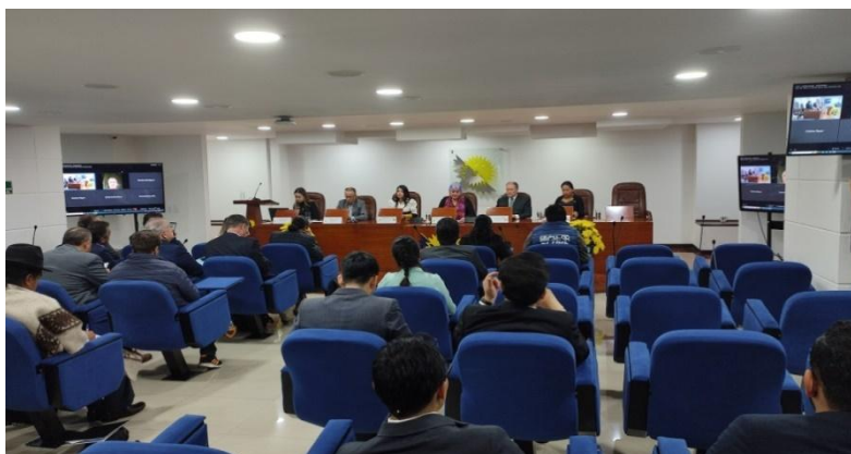
Imagen 4 (18/11/2022). Sesión plenaria donde se aprobaron diversos Pronunciamientos y Marcos Normativos

El objetivo de esta Norma es el desarrollo de acciones para garantizar la promoción e implementación de los programas y/o las carreras de formación a nivel técnico y tecnológico que impulsan la competitividad y la productividad de la región andina; así como el desarrollo socioeconómico y ambiental de la población.