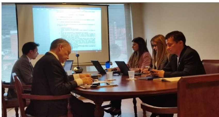
Imagen 2 (17/11/2022). Sesión de la Comisión Cuarta “De Economía”

Posteriormente, se procedió a la elección del vicepresidente de la Comisión. Sobre el particular, a propuesta de la Presidenta, fui elegido en dicho cargo por unanimidad.