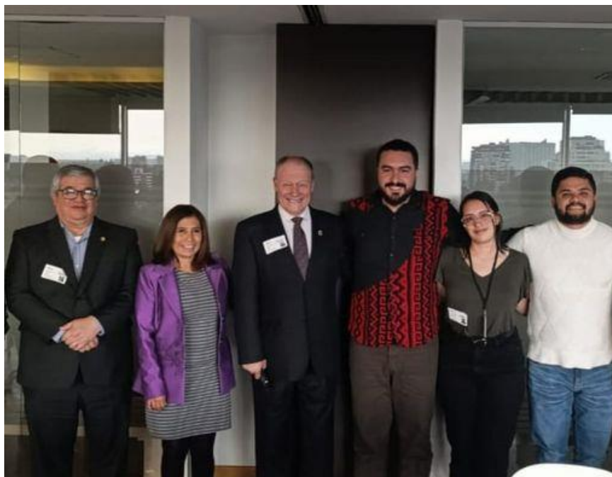
Imágenes: Reunión con los funcionarios de la Autoridad Nacional de Licencias Ambientales (30/10/2024)