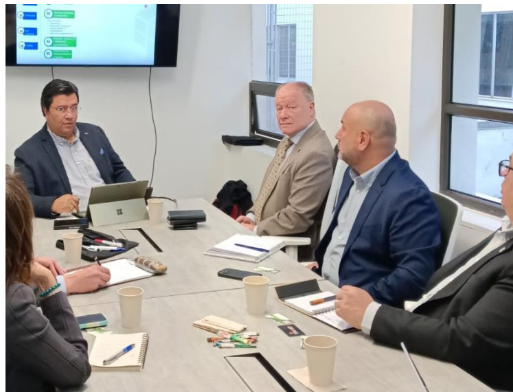
Imágenes: Reunión con FEDEMADERAS en Colombia (29/10/2024)