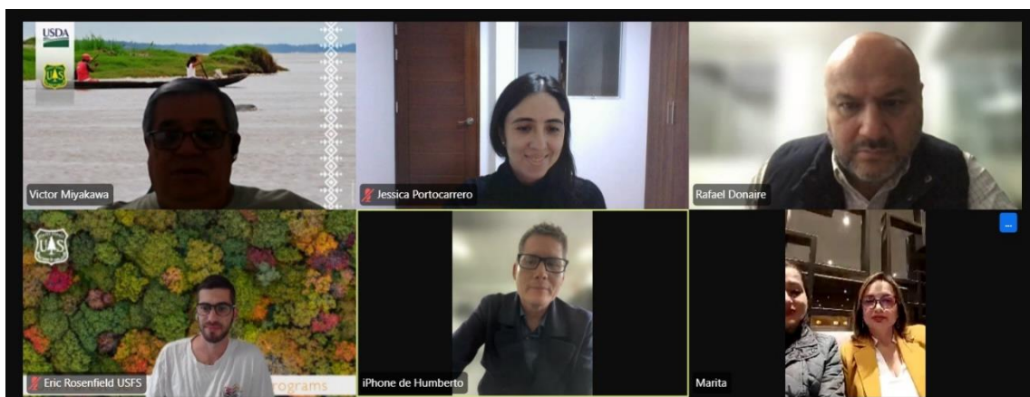
Imagen: Reunión con funcionarios de la USFS e ILAT (23.10.2024)

Asimismo, se mencionó la importancia de conocer quiénes son los puntos de contacto técnico, ello nos permitirá la construcción de una agenda regional andina que facilite el combate a la tala ilegal y promueva la cadena de valor de la madera en los países andinos.