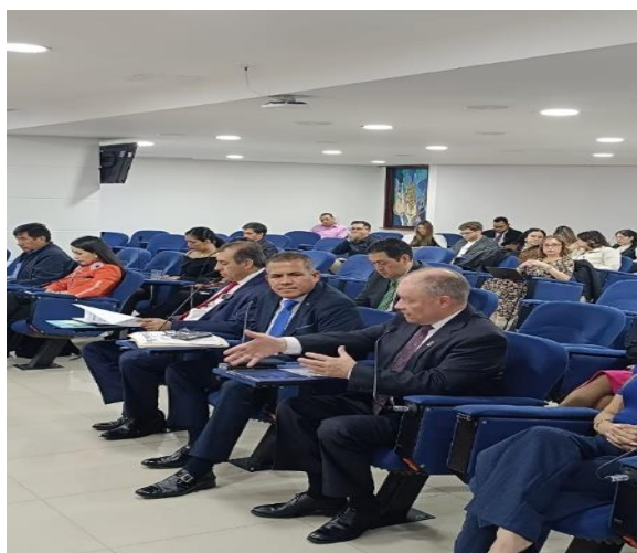
Imagen: Debate en la Sesión Plenaria (25/10/2024)