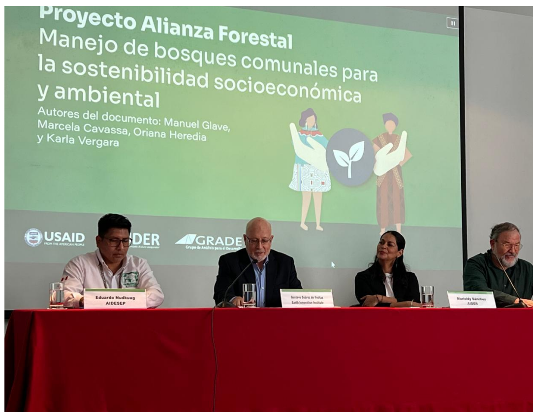
Imagen: Foro de AISEC 04/10/2024

El objetivo del evento fue presentar el documento de sistematización del Proyecto Alianza Forestal preparado por el GRADE. Este documento analiza los resultados clave, las condiciones habilitantes y las lecciones aprendidas del proyecto con el objetivo de impulsar la réplica y escalamiento del modelo MBC, su gestión y las estrategias de construcción de alianzas estratégicas.