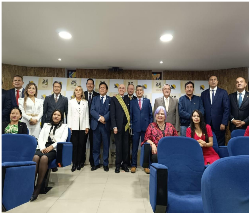
Imagen: Sesión Solemne por el Aniversario 45 del Parlamento Andino (24/10/2024)