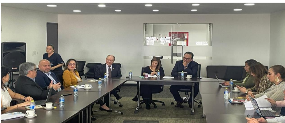
Imágenes: Reunión con el procurador delegado de Medio Ambiente (30/10/2024)