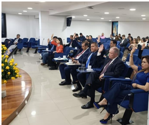
Imagen: Votación y aprobación de diversos pronunciamientos de la Plenaria (25/10/2024)