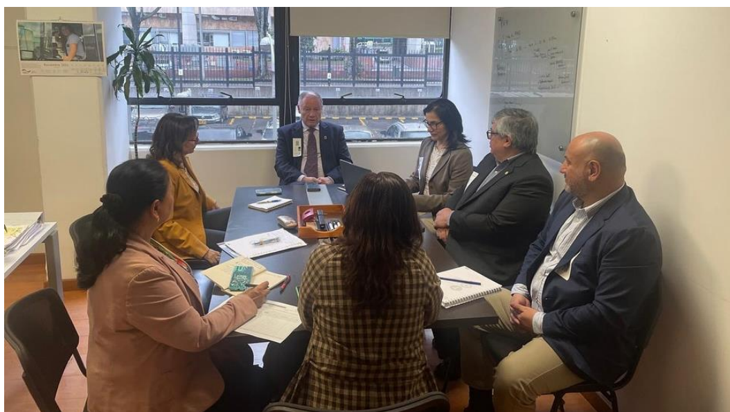
Imágenes: Reunión con las funcionarias del Ministerio de Ambiente (30/10/2024)