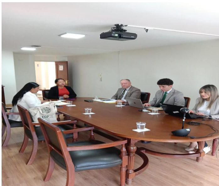
Imagen: Sesión de la Comisión Quinta (23/10/2024)

Una vez terminado este punto, y no habiendo más por revisar, se dio por terminada la sesión