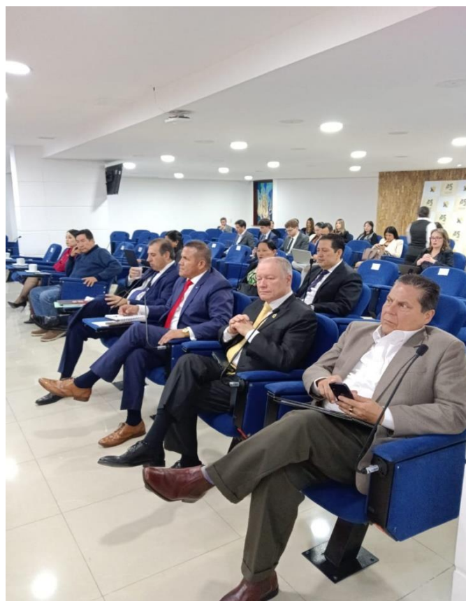
Imagen: Sesión Plenaria (24/10/2024)