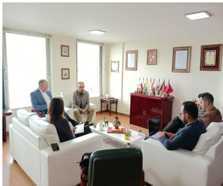
Imágenes: Reunión con el secretario general del Parlamento Andino, para la planificación de actividades de la Comisión Especial “De Futuro” (22/10/2024)