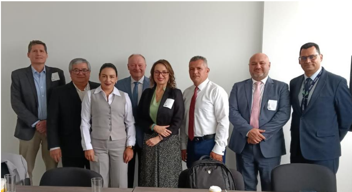
Imágenes: Reunión con DEMA de la Fiscalía General de Colombia (28/10/2024)