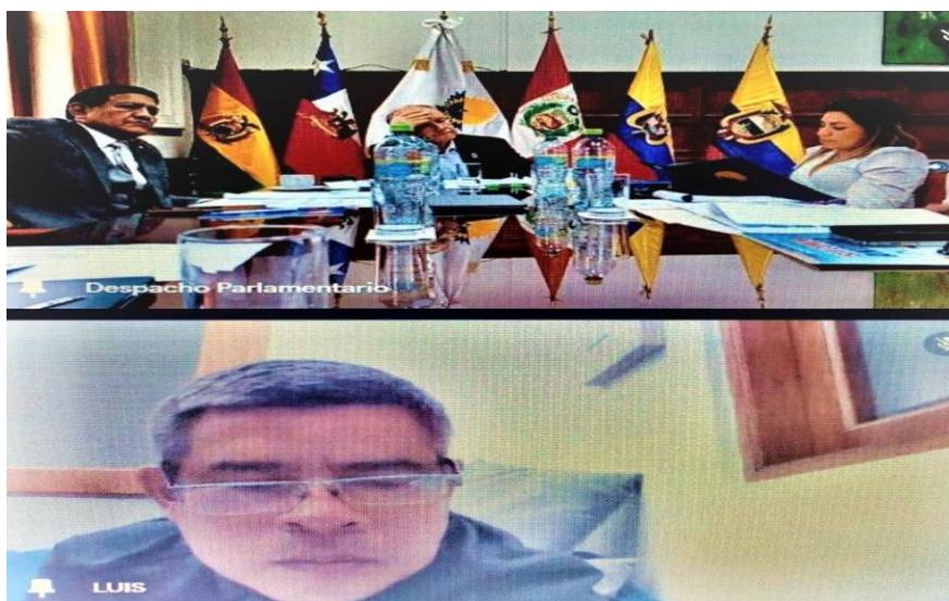
Imagen 4 (11/10/2022). Sesión ordinaria de la Representación Parlamentaria Peruana

Asimismo, se tomó conocimiento de los avances en la implementación del sitio web del Parlamento Andino Perú, el envío de boletines informativos a los suscriptores y la actualización de notas de actividades para conocimiento de la ciudadanía. Además, se tomó el acuerdo de programar una reunión de trabajo para la revisión detallada del Plan de Gestión Anual actualizado.