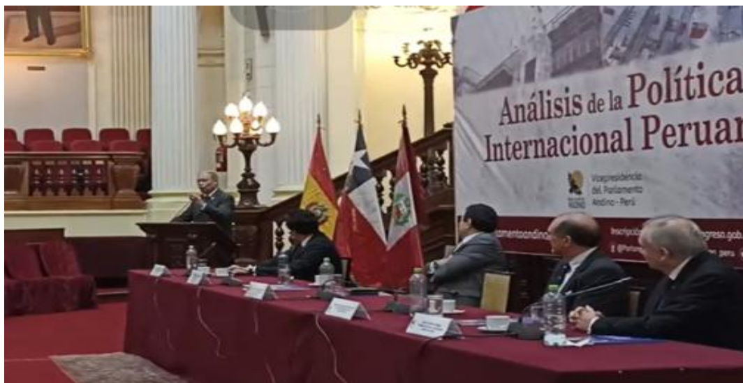
Imagen 6 (20/10/2022). Conversatorio “Análisis de la Política Internacional Peruana”