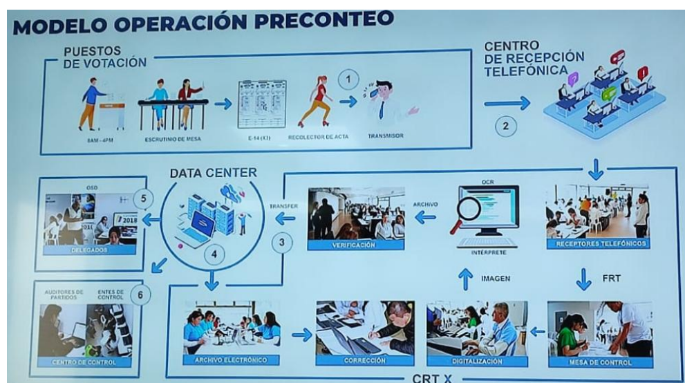
Imagen 14. Modelo de Operación del Preconteo