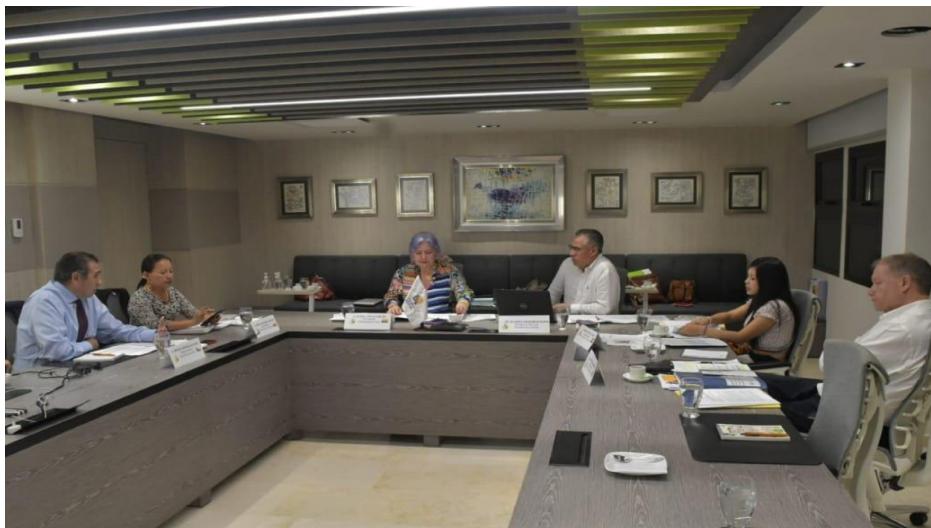
Imagen 1 (27/10/2022). Sesión de Mesa Directiva

Durante esta reunión también se aprobó la agenda del periodo de sesiones de noviembre y el informe de ejecución financiera de setiembre. Asimismo, se tramitó y derivó a Comisiones los proyectos de pronunciamiento presentados.