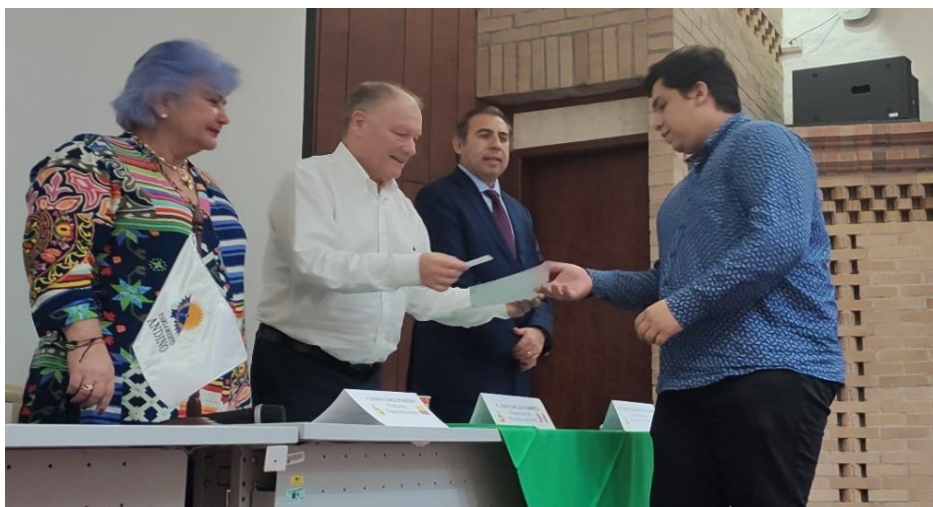
Imagen 8 (27/10/2022). Posesión y juramentación de los estudiantes de la Universidad Industrial de Santander (UIS)

El Parlamento Andino Universitario es una iniciativa que reconoce la necesidad que nuestra región cuente con líderes formados en las diversas materias que requiere un decisor político; asimismo, la necesidad de ir formándolos en la práctica política a través de la simulación de sesiones parlamentarias, discutiendo iniciativas legislativas y de control político como en un Parlamento.