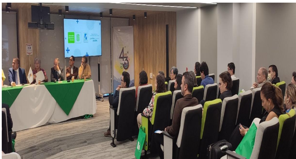
Imagen 9 (28/10/2022). Ceremonia de creación de la Red Andina de Universidades Acreditadas

Entre las formas de cooperación que establece este acuerdo se encuentran: actividades de investigación conjunta en temas de interés común; intercambio de personal docente e investigador, parlamentario, funcionario y estudiantes en los campos de cooperación que se establezca; fortalecimiento de integración andina y latinoamericana; propuestas de implementación de medidas de calidad e integración de la enseñanza universitaria en todos los niveles educativos y ámbitos de conocimiento científico; y cursos de especialización y formación profesional.