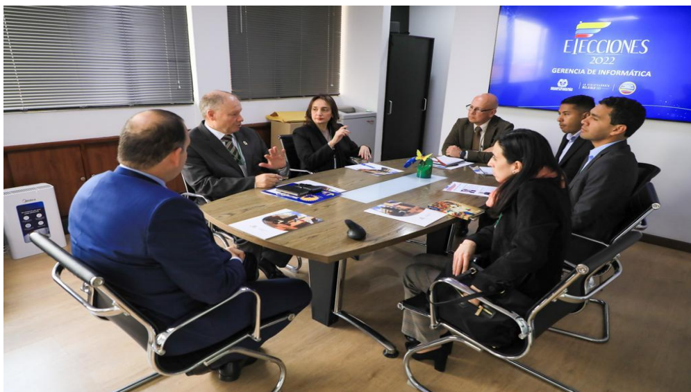
Imagen 11 (25/10/2022). Reunión de trabajo con Registraduría Nacional de Colombia

Culminada la reunión, se acordó continuar la colaboración entre el Parlamento Andino y la Registraduría Nacional para mejorar las prácticas del sistema electoral de nuestros países, buscando generar predictibilidad sobre los resultados electorales, aspecto fundamental para construir democracia.