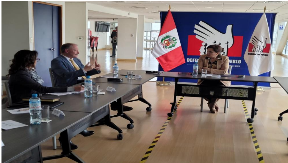
Imagen 10 (13/10/2022). Reunión de trabajo con Defensora del Pueblo (e)

Finalmente, en la reunión se trató el tema de embarazo adolescente que también aborda la Defensoría. Al respecto, nos comprometimos a enviar los avances que tiene el Parlamento Andino en la materia para colaborar y contribuir en su rol supervisor.