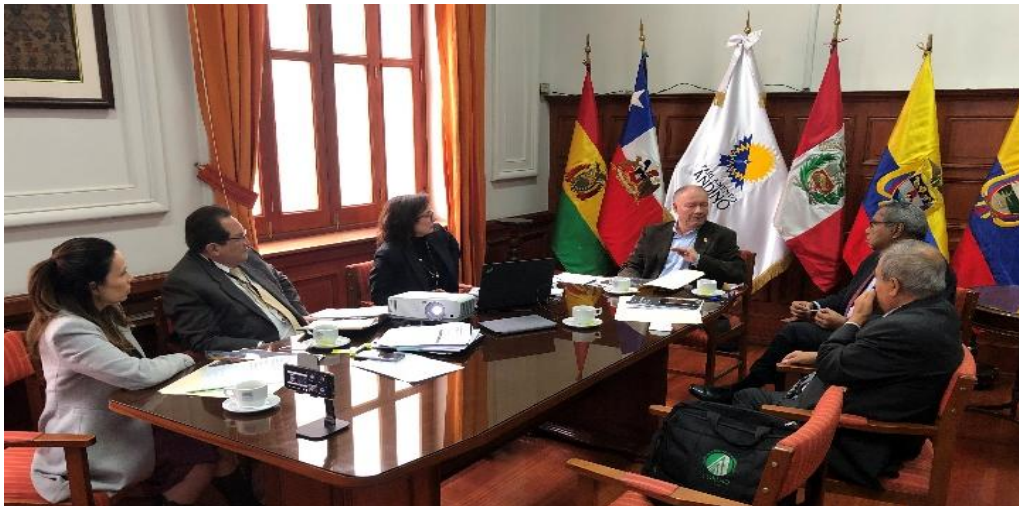
Imagen 12 (17/10/2022). Reunión de trabajo para revisión del Plan de Gestión Anual de la Representación Parlamentaria Peruana

Objetivo 7: Implementar mecanismos para la difusión de la gestión y logros de la ORP - Perú.