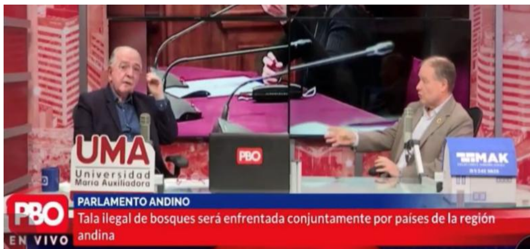
Imagen 13 (03/10/2022). Entrevista en el programa “PBO con Chema Salcedo”

derecho al olvido, apertura de Cámaras de Comercio, apoyo a instituciones de bomberos, y reconocimientos a comunidades para que puedan acceder a fondos internacionales de conservación.