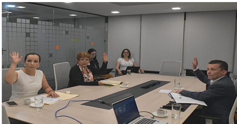
Imagen 2 (27/10/2022). Sesión de la Comisión Cuarta “De Economía”