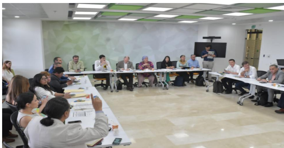
Imagen 3 (28/10/2022). Sesión plenaria