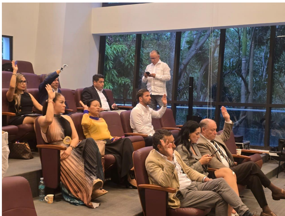
Imagen: Votación de los informes de las Comisiones en la sesión Plenaria (31.01.2025)

Posteriormente, fueron aprobados los siguientes proyectos de Resolución y Recomendación: