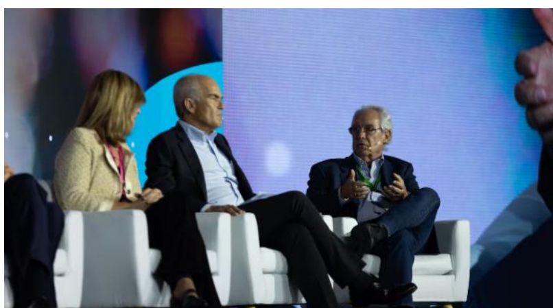
Imagen: Foro Económico CAF 2025. Panel “¿Cómo retomar la senda de crecimiento en un escenario de coyuntura desafiante?” (29.01.2025)

- Los panelistas coincidieron en que Latinoamérica es muy grande y sus problemas están “sobre diagnosticados” , cada país es una realidad diferente, pero hay que ponernos en acción frente a la inseguridad.