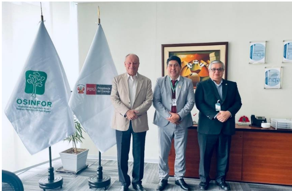
Imagen: Reunión con el jefe del Organismo de Supervisión de los Recursos Forestales y de Fauna Silvestre – OSINFOR (09.01.2025).

Asimismo, resaltó que este taller constituirá un espacio de coordinación que permitirá identificar puntos de trabajo en común, estudios comparativos para la medición de la tala ilegal, intercambio de información para la detección de actividades ilegales, además de conocer los avances tecnológicos para abordar esta problemática.