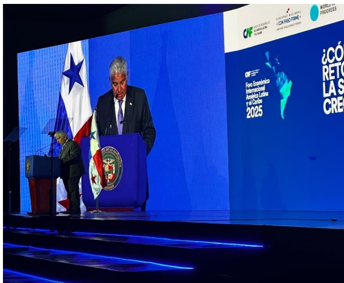
Imagen: participación de José Mulino, presidente de Panamá (29.01.2025)