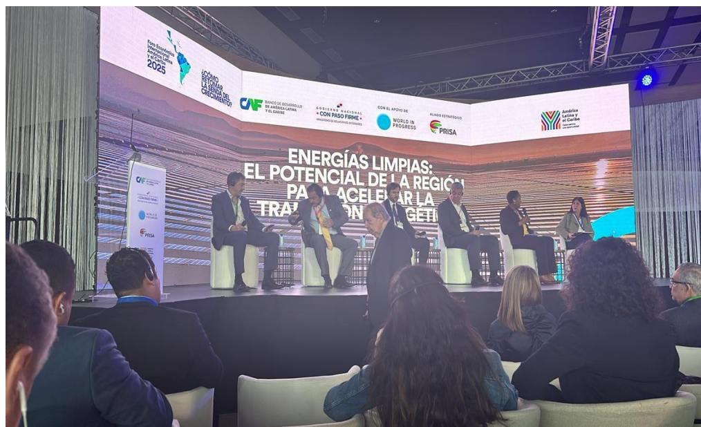
Imagen: Foro Económico CAF 2025. Sesión “Energías limpias, el potencial de la región para acelerar la transición energética” (29.01.2025)

Con relación al gas natural, hay que considerar que el 75% de lo que consumimos es producido en nuestra misma región, que el gas natural representa el 30% de la matriz total global y que se proyecta que en el año 2050 represente un 23% de esta matriz, lo que lo convierte en una presencia robusta frente a la descarbonización.