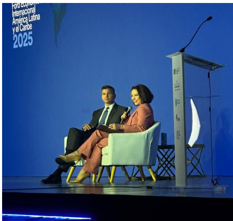
Santiago Peña, presidente de Paraguay (29.01.2025)