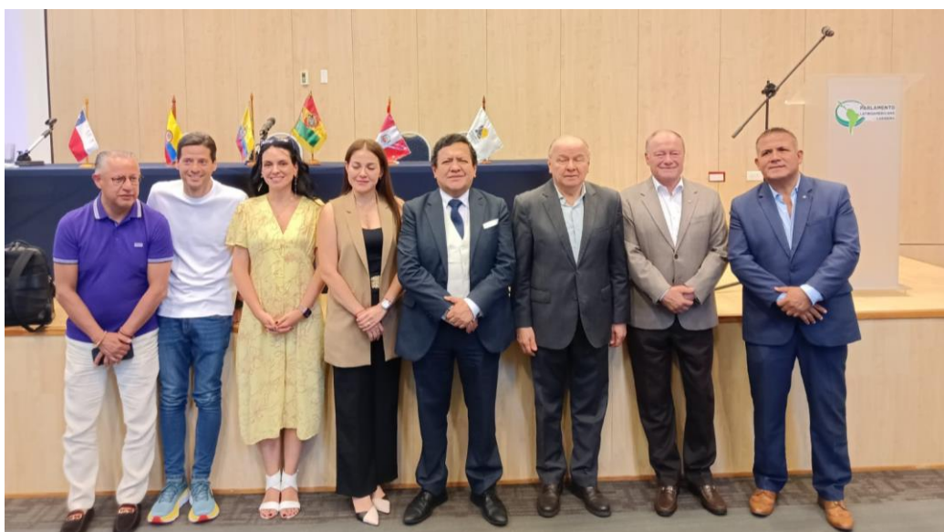
Imagen: Presentación del Plan de Gestión Institucional del Parlamento Andino para el 2025 (27.01.2025).

En esta importante reunión se revisaron los temas que serán abordados en las diferentes comisiones de trabajo del organismo con miras a ser aprobados por la Plenaria, de acuerdo con nuestra función de generación normativa, orientado a enriquecer el ordenamiento jurídico de nuestra región.