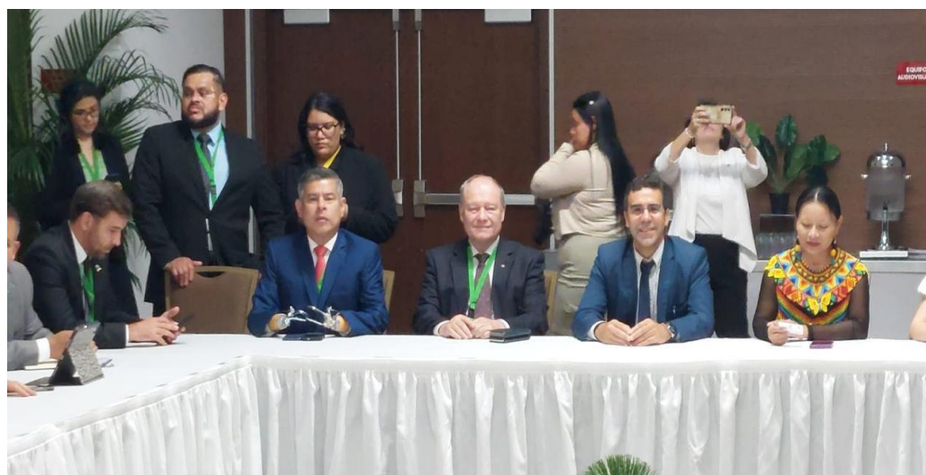
Diálogo informal con CAF y PARLATINO (30.01.2025)