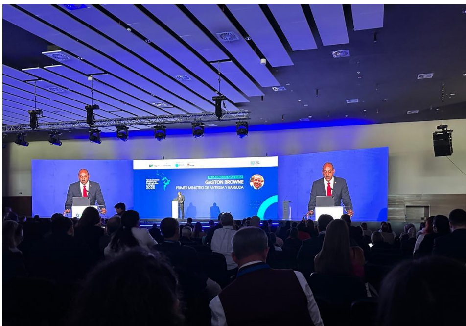
Gastón Browne, primer ministro de Barbuda y Antigua (30.01.2025)

En su intervención, Browne señaló que la tecnología y la innovación, así como la formación del capital humano, son las claves para el desarrollo sostenible en su país. En la actualidad Antigua y Barbuda es la primera isla del Caribe que cuenta con un 100% de sus actividades basadas en energía sostenible, por lo que el primer ministro identificó las iniciativas de su país respecto al cambio climático.