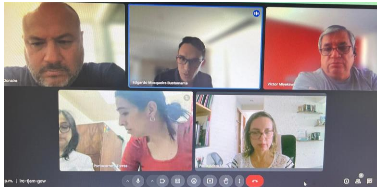
Imagen: Reunión de coordinación la con USFS, para la preparación del Segundo Taller Regional de Difusión sobre Marcos Normativos en Materia Ambiental (14.01.2025).

El equipo de mi despacho y el del Servicio Forestal acordaron llevar a cabo reuniones semanales para coordinar las actividades previas que se requieren para la realización del Segundo Taller Regional de Difusión de Marcos Normativos en Materia Ambiental.