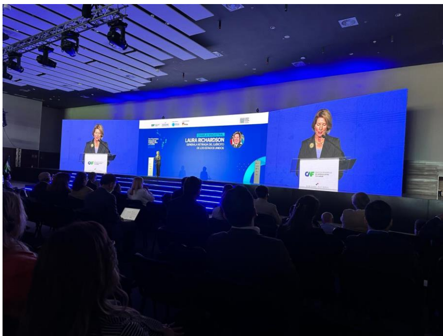
Laura Richardson, Generala en retiro del ejército de los EEUU (30/01/2025)