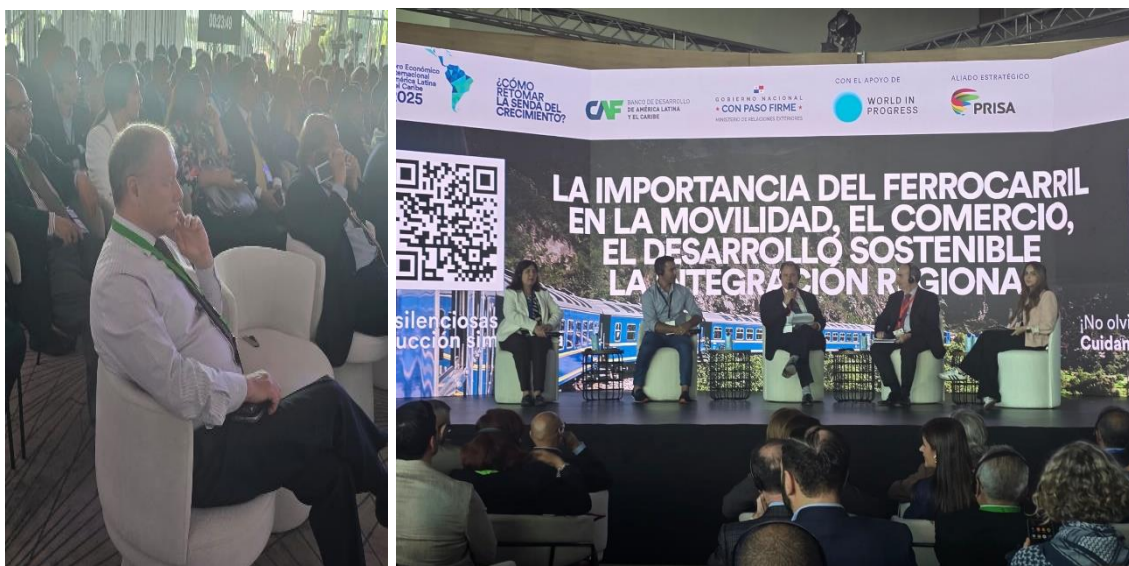
Imágenes: Foro Económico CAF 2025. Sesión “La importancia del ferrocarril en la movilidad, el comercio, el desarrollo sostenible y la integración regional” (30.01.2025)

En otro punto, se resaltó la falta de una integración intermodal, más aún cuando a la fecha no existen modelos regionales, lo cual es una necesidad apremiante.