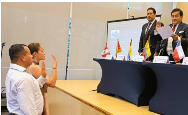
Imagen: Sesión Plenaria, juramentación de parlamentarios (31.01.2025)