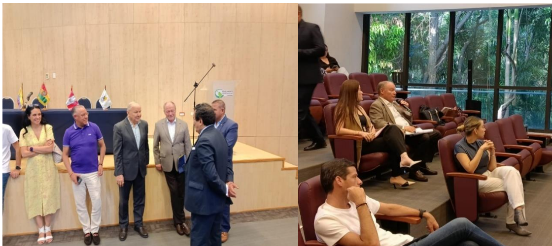
Imagen: Presentación del Plan de Gestión Institucional para el 2025 (27.01.2025).